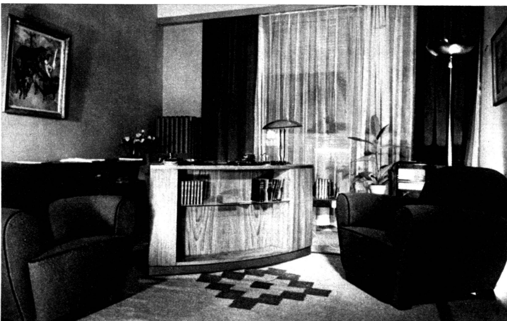
Coin de feu. Pierre Genoud, ensemblier.