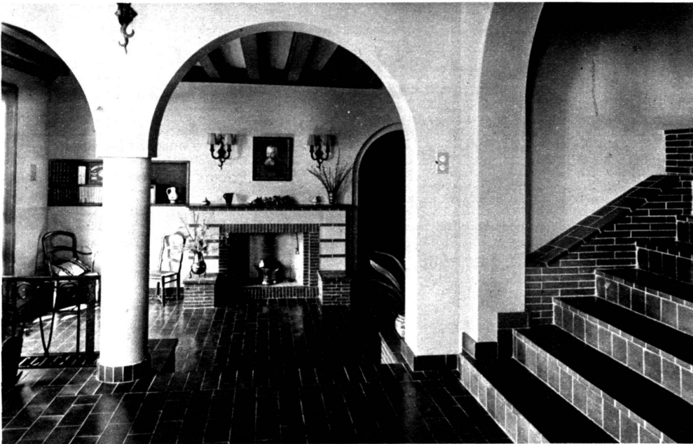
Hall. R. Bonnard, architecte.