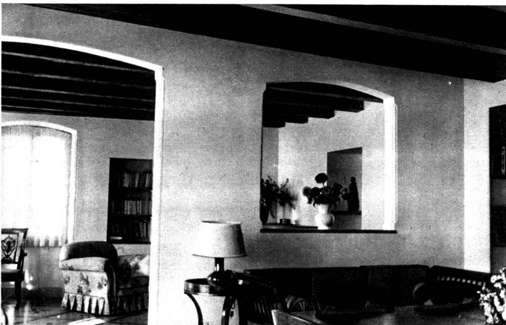
Intérieur à Riex. J.-P. Vouga, architecte.