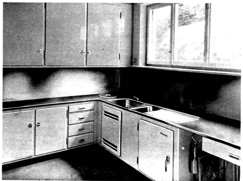
Excellent exemple de cuisine bien organisée.