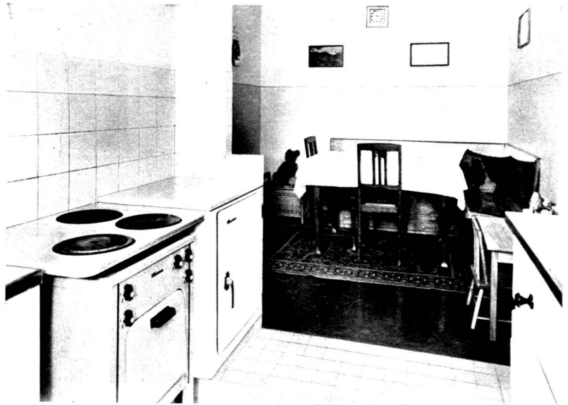
Intéressante solution de cuisine doublée d'une niche faisant salle à manger.

L'installation d'une cuisine est avant tout une question de méthode. De même que la méthode a conduit le fabricant aux modèles actuels de plonges ou d'armoires de cuisine, de même, c'est la méthode qui doit présider à la disposition de ces divers appareils. Une cuisine doit être organisée, toutes proportions gardées, exactement comme une usine. Deux groupes d'opérations, donnant naissance à deux circuits, se partagent la cuisine : circuit d'aller (préparation des mets) comprenant l'achat et le magasinage des denrées, la préparation et la cuisson ; circuit de retour (vaisselle) comprenant le lavage et le rangement de la vaisselle, la conservation des mets. Ces deux suites d'opérations se produisant, dans une cuisine de ménage, à des temps différents, sont aisément superposables, comme l'indique notre schéma. L'évier, à deux compartiments, en est le centre, accompagné, à droite et à gauche, par deux égouttoirs. A l'une des extrémités se trouve la cuisinière, à