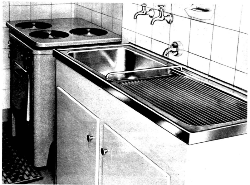
Un des résultats de la technique d'aujourd'hui.