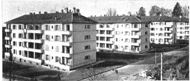
Ci-dessus : Ensemble des quatre groupes vus du nord-est. Au premier plan, nouvelle avenue créée par la ville de Lausanne.