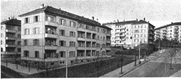
Ci-dessous : Ensemble des groupes d'Ouchy des 1 er et 2 e périodes. Au premier plan, l'avenue de la Harpe. Au second plan, le groupe I construit en 1935-1936. Au fond, le groupe d'Ouchy de la Société coopérative d'habitation construit en 1933.