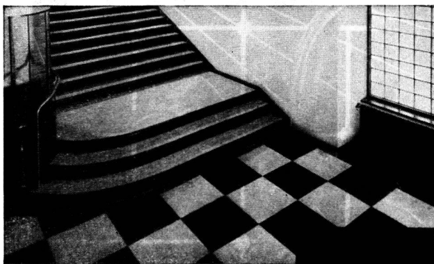
revêtement d'escalier en caoutchouc

Demandez des échantillons, prospectus et listes de références.