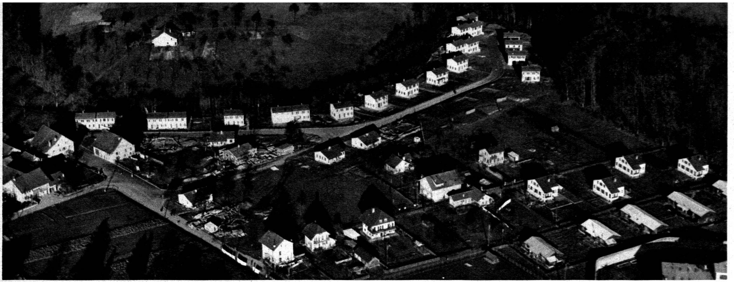
Vue aérienne pendant la construction.