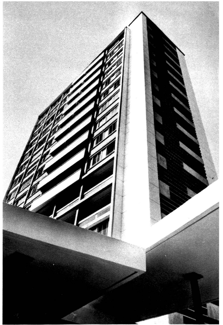
L'immeuble tour: vue depuis le portique d'entrée.