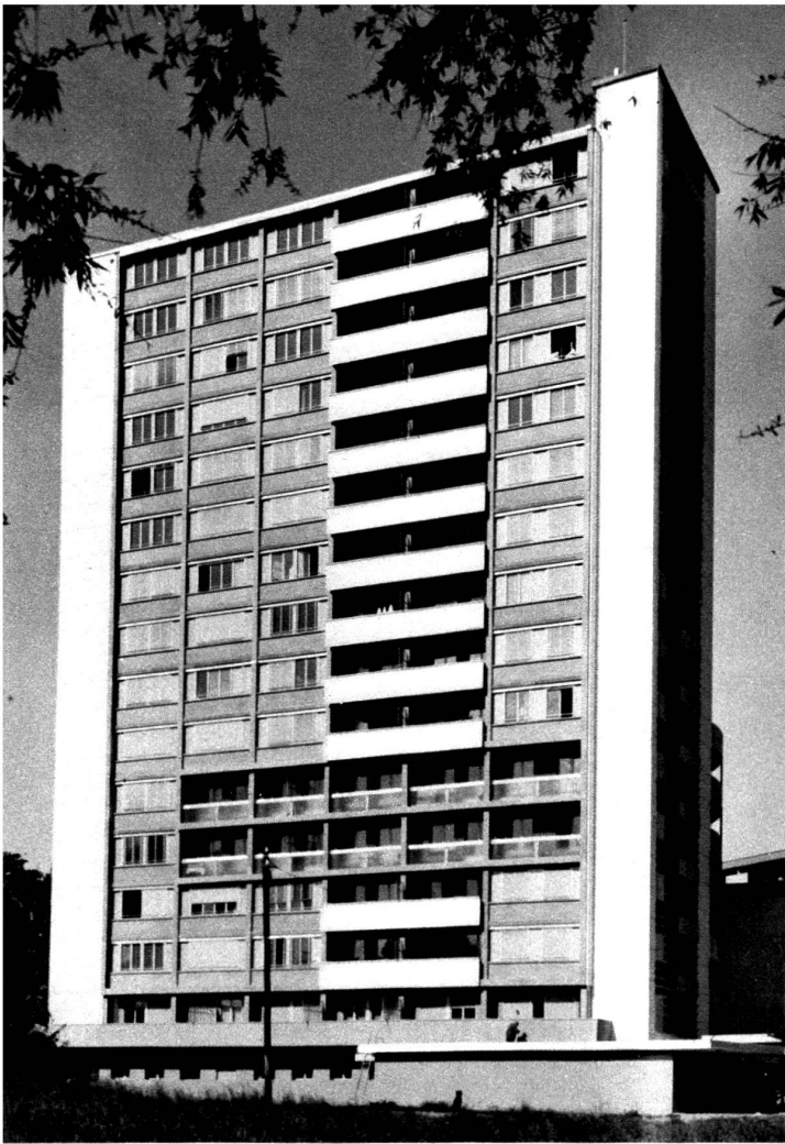
La façade est.