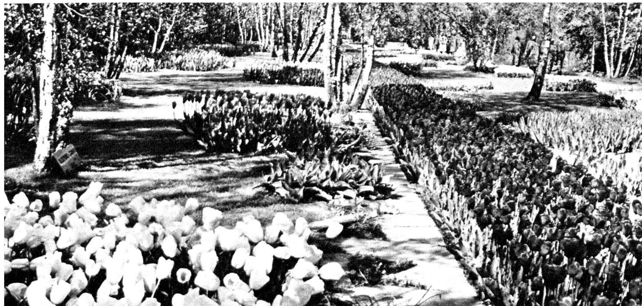
Un autre beau jardin, à la gloire des tulipes des Pays-Bas: Keukenhof