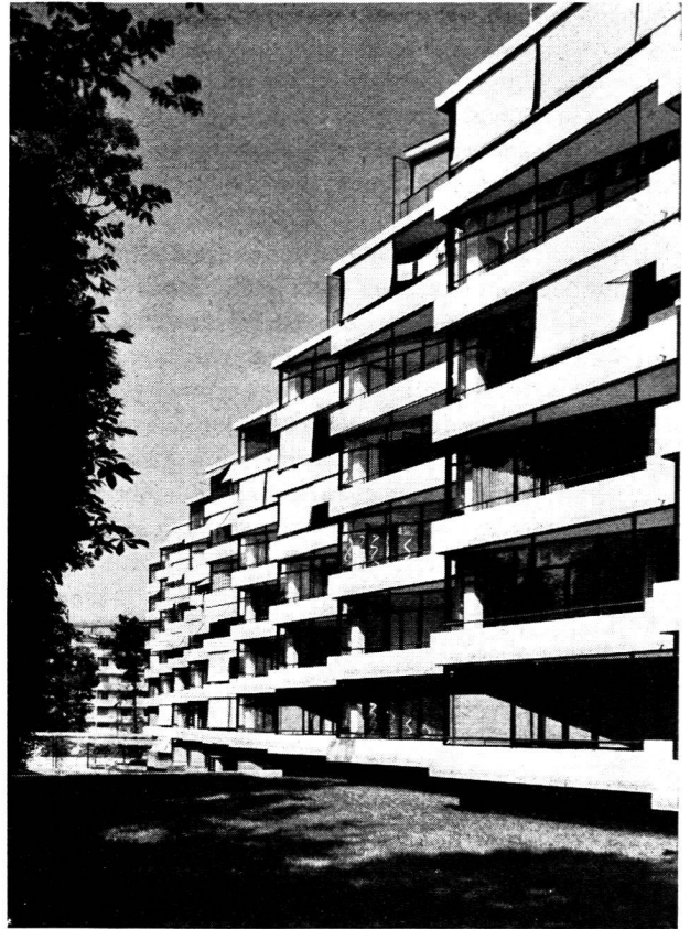
Immeuble Miremont, à Genève. Marc-J. Saugey, architecte FAS.

C'est cependant dans ces difficultés qu'il faut trouver ce ferment qui fait surgir en Suisse, dans la variété des tâches auxquelles le même architecte a souvent à faire face, cette remarquable continuité dans la qualité. Elle est