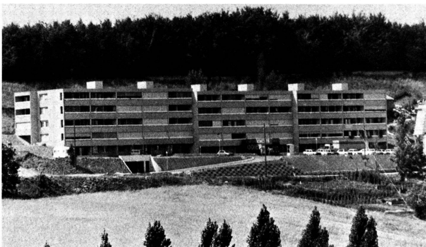
Deux groupes d'immeubles en cours de construction à Ecublens où travaillent quatre entreprises coopératives de production lausannoises dans six corps de métiers différents.

de travail ou de difficultés quant à la reconnaissance du syndicat en tant que partenaire de contrat ou aux tractations. Les entrepreneurs avaient des listes noires, et quiconque s'exposait pour la cause de ses collègues de travail ou du syndicat, se voyait rapidement figurer sur cette liste. Inutile de préciser ce que cela signifiait à l'époque où le patronat disposait d'une immense réserve de main-d'œuvre, vu le chômage étendu. L'entraide exercée par ceux qui subissaient des sanctions signifiait conservation, et la coopérative de production était un des moyens de cette entraide.