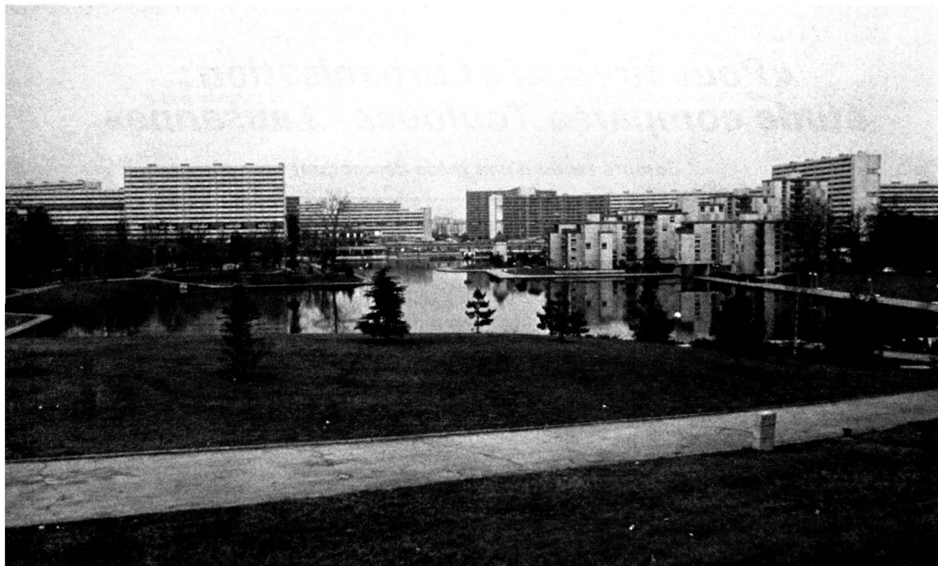
Photo d'une des dernières tranches de réalisation ; au bord du lac artificiel, des petits immeubles au caractère résidentiel marqué ; par derrière, les immeubles HLM.

Lausanne — moins de 10 %. Ce sont là les principales différences découlant des données purement techniques et statistiques du cadre bâti.