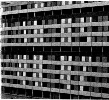
Toulouse-Le-Mirail : un des premiers bâtiments réalisés ; tous les 4 étages on trouve une coursive extérieure qui permet de parcourir toute la longueur de la construction.