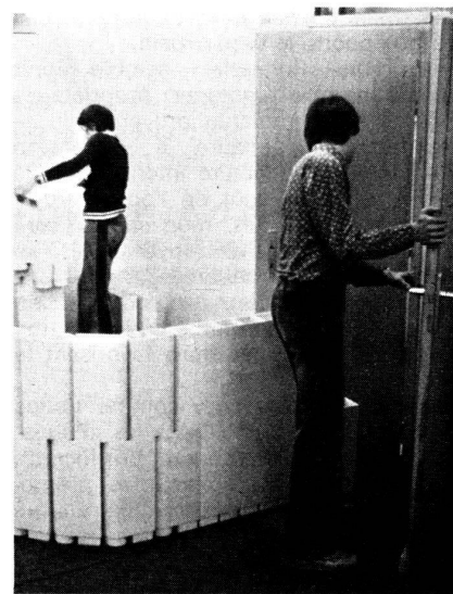
Au LEA, les futurs habitants construisent la maquette — grandeur réelle — du logement qu'ils souhaitent.

Munis de leurs plans, les futurs usagers peuvent, au LEA, construire en «léger»