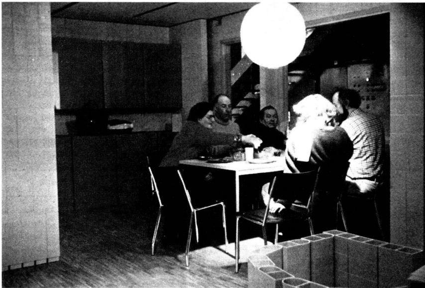
Pour expérimenter l'espace, un pique-nique dans la maquette du logement.

leur futur logement et visualiser l'ensemble fini. La plupart du temps, des modifications sont nécessaires, qu'il est plus facile d'appliquer aux plans bien évidemment.