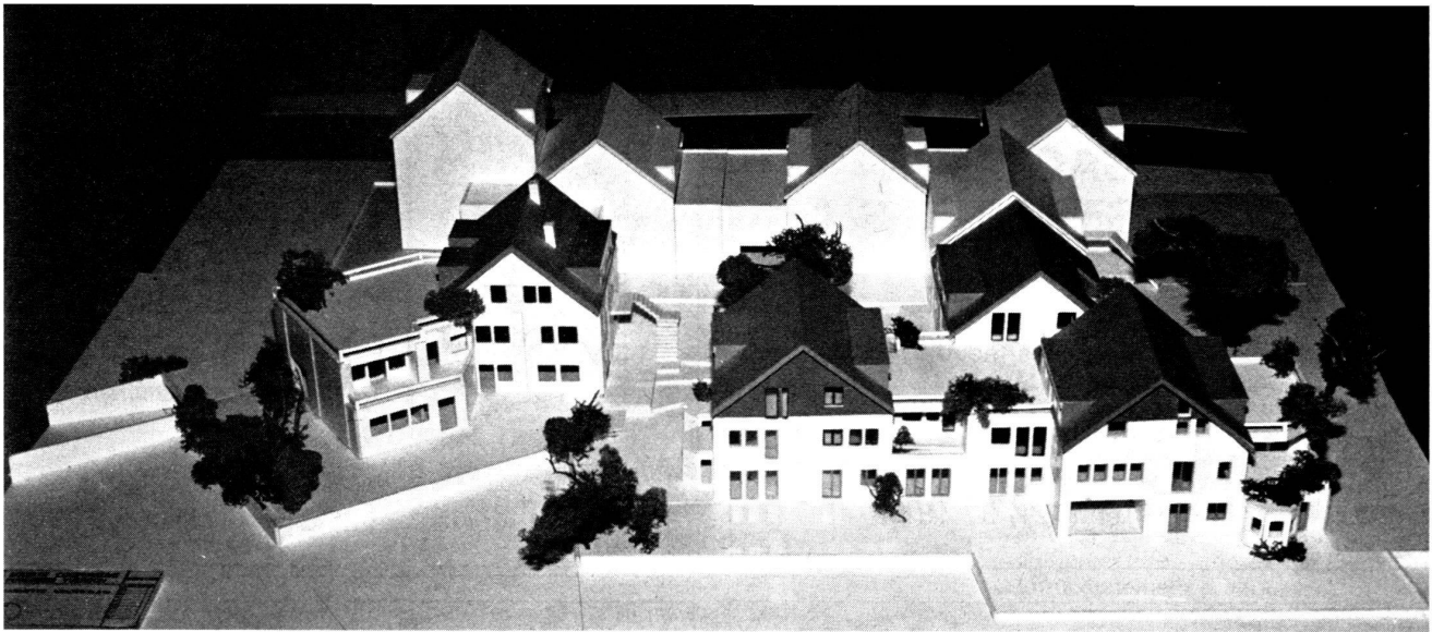
Maquette de la première étape.