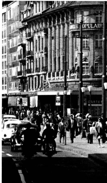
La ville, un lieu privilégié de l'espace

En raison de ces transformations, dans les sociétés industrielles avancées, il n'est plus possible de parler de villes et de villages; le concept de région urbaine correspond à un vaste ensemble de zones plus ou moins grandes, spécialisées et hiérarchisées ; s'y côtoient des zones industrielles, commerciales, administratives, de résidence, de loisirs, agricoles, etc. Le tout est ponc-