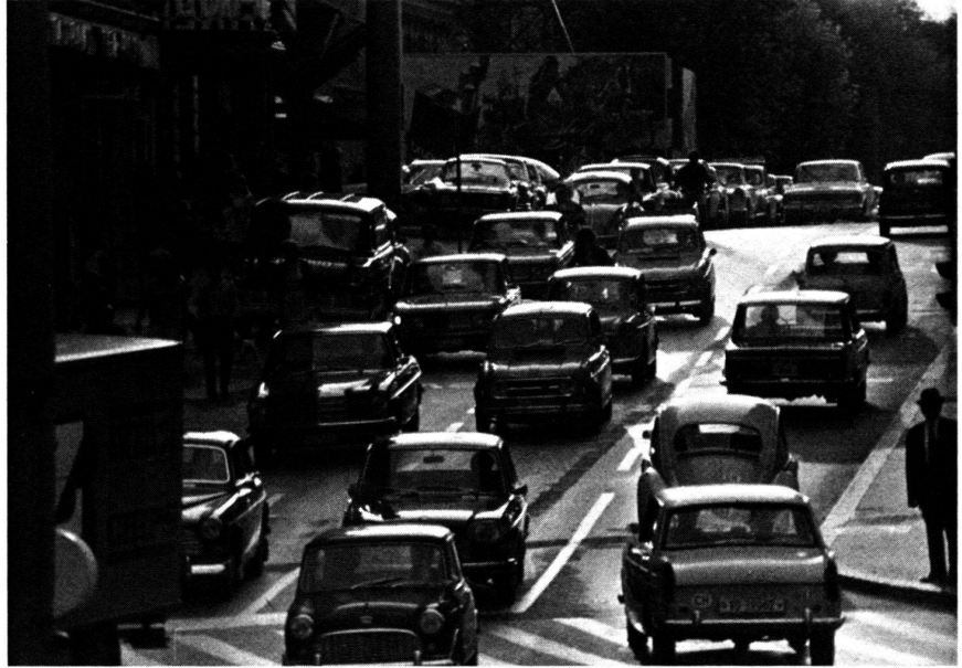
Mouvements de population de toute nature...

La première condition , c'est l'interdisciplinarité. Il est impossible de compren-