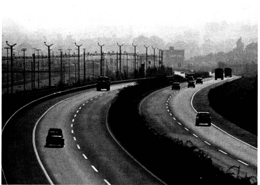
L'automobile a contribué à la dispersion urbaine

«Au moment de la deuxième révolution industrielle, la généralisation de l'énergie électrique et l'utilisation du tramway permirent l'élargissement des concentrations urbaines de main-d'œuvre autour d'unités de production industrielle de plus en plus vastes. Les transports collectifs ont assuré l'intégration de différentes zones et activités de la métropole, répartissant les flux internes suivant une relation temps/espace supportable. L'automobile a contribué à la