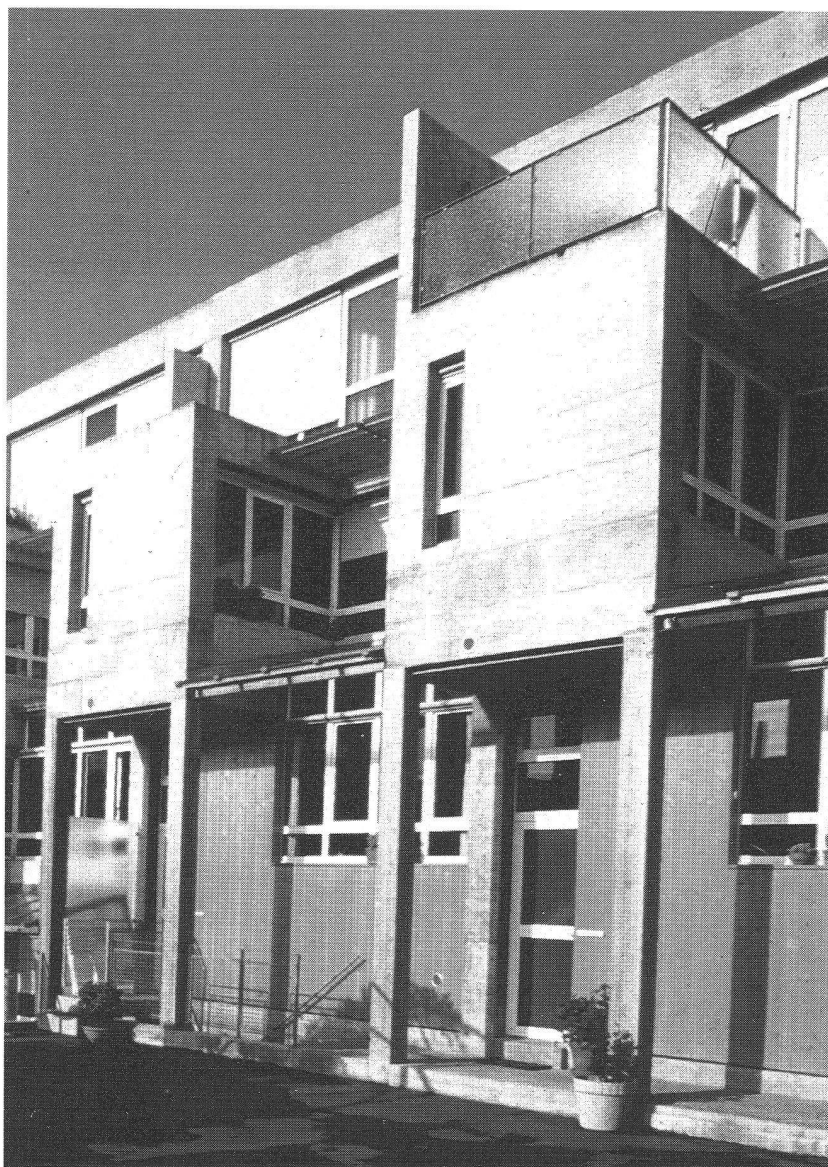
La cité de Ried

Donc, anything goes , au moins aussi longtemps que le revenu permet de telles aspirations. Cependant, ceci n'étant pas le cas pour une majorité de la population, les investisseurs n'argumentent pas sans raison que, vu les possibilités infinies pour ré-