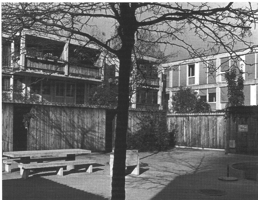
La cité Lorraine à Berthoud

pondre aux besoins de logements, il est plus adéquat d'offrir une solution moyenne. Celle-ci agit obligatoirement de façon uniforme pour des raisons économiques, car l'aspect d'un bâtiment se définit principalement par le nombre d'étages, la forme du toit et de l'immeuble, par le matériau, les portes, les fenêtres et les façades, ce qui conduit, justement par une combinaison avantageuse des frais, à des constructions à quatre étages, à des toits plats, au béton lavé, à des éléments en matière synthétique et à d'autres caractéristiques de construction d'appartements courants.