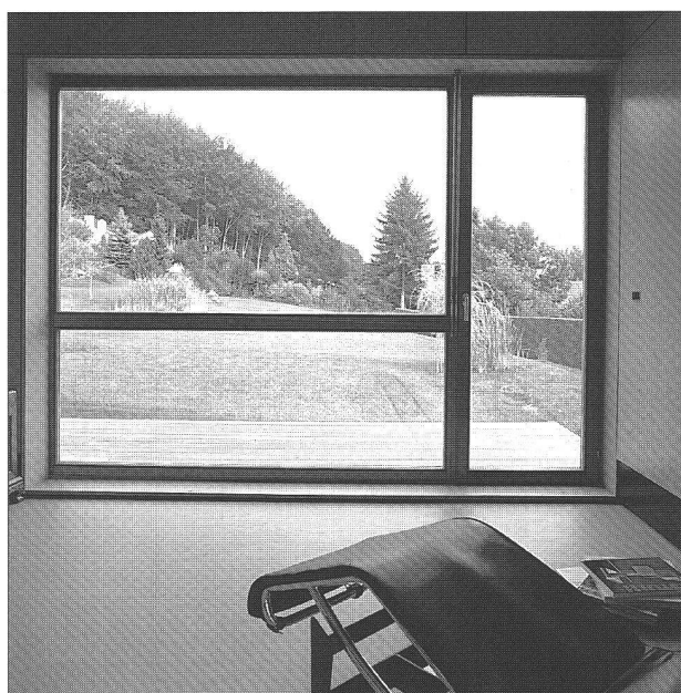
L'idéal de la maison individuelle c'est son identification entre l'habitat et la nature. Mais cet idéal comporte des contraintes que le plan de situation ci-contre explicite. Car il faudra relier la petite masse noire de la villa (en haut à gauche) aux infrastructures existant au village.

La juste relation avec l'environnement constitue le facteur dominant de la qualité d'une maison individuelle; bon nombre de constructeurs livrent, à ce sujet, des solutions de qualité douteuse aux utilisateurs: promiscuité avec le voisinage, terrasses terrassées sans discernement, accès malaisé des véhicules, arborisation inadaptée.