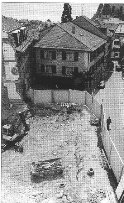
Vue des travaux de terrassement sur l'emplacement de la rue Cité-d'arrière N° 20. Ci-dessous, vue panoramique et «anticipative» (documents GECO).

Malgré cette situation encore sombre, Philippe Diesbach estime que la