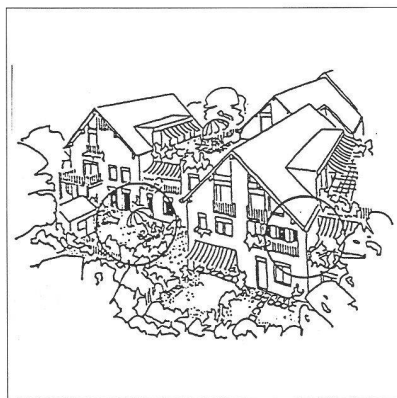
Une publicité du Groupe Y, architectes, et de la coopérative Les Pugessies traduit bien l'actualité de la cité-jardin.

lective qu'il faut chercher la « recette » d'une forme coopérative d'habitat 3 . La première s'épanouit dans la maison familiale et dans son prolongement, le jardin, la seconde dans les principes d'économie et dans la