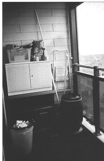
Ci-dessous : cagibi improvisé

L'armoire à chaussures d'une saison à l'autre, le porte-habits, la caisse à jouets, le tricycle du petit qui a grandi, les skis et la luge, les pneus «neige» de la voiture, bref, tout ce que l'on aurait mis autrefois dans une cave ou un grenier, nous le déposons dans ce cagibi extérieur, et renonçons ainsi à un autre usage, plus convivial et plus ludique de cet espace.