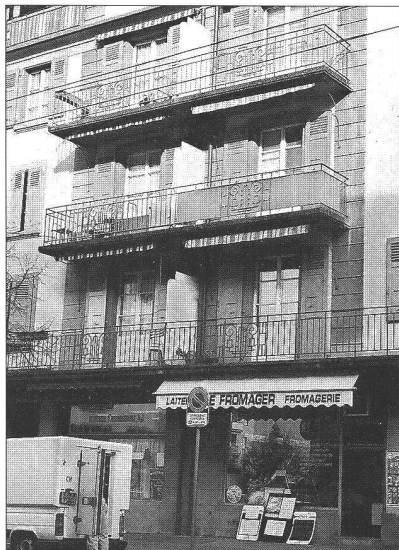
Ci-dessous : solitude des balcons

- la loggia porte bien son nom : petite loge, enfoncement dans la façade, selon Le Robert, elle invite à ce que l'on s'y tienne, elle offre un abri, lorsqu'elle est couverte. Elle est le plus souvent investie comme une pièce de séjour extérieure. Souvent, les habitants y ajoutent des aménagements, rideaux ou stores, qui l'enferment encore plus. Il n'est pas rare qu'elle se transforme alors en véritable pièce du logement, en jardin d'hiver, ou en serre, aujourd'hui très prisés.