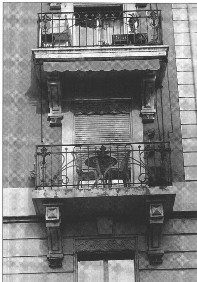
Ci-dessus : le charme du minimalisme

Pour se donner plus d'intimité, les garde-corps, souvent ajourés, sont obstrués par des tissus, des nattes, ou parfois plus modestement par des plaques de plastique. Verticalement, on y installe des bouts de parois qui dissuadent le regard indiscret. Offense à l'architecture des toits, mais aubaine pour les promoteurs, les balcons-baignoires sont très appréciés par ceux qui cherchent la discrétion et l'intimité. Véritables «nids», à l'écart des regards, ils se prêtent à merveille à être investis comme une chambre extérieure.