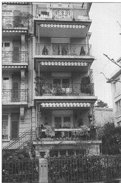
Ci-dessus : balcons où il fait bon vivre

Au tournant du siècle également, on assiste en France à un changement d'attitude envers les constructions en milieu urbain ; jusqu'alors, la réglementation imposait l'alignement rigoureux des façades. Les éléments en saillie ne pouvaient dépasser que très modestement et n'être que peu saillants. A partir des années 1900, on abandonne cette rigueur et on voit exploser la créativité des bâtisseurs qui dotent leurs projets d'éléments décoratifs tels les oriels, les bow-window et les balcons. Lausanne, à son tour, s'en inspire et possède encore de magnifiques exemples de telles réalisations.