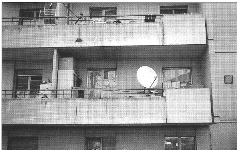
Ci-dessous : un balcon qui vaut bien une pièce ... mais de rangement

pousser des fleurs ou du persil, où l'on crée son petit jardin d'agrément ou son potager, parfois une forêt vierge dont les cascades de verdure peuvent aller jusqu'à incommoder le voisin d'en bas, tout en apportant parfum, couleur, ombre et fraîcheur à ses habitants. N'a-t-on pas assisté au concours du «plus beau balcon fleuri», fierté de son auteur, image de marque de son «chez soi», référence de l'immeuble, repère dans la rue.