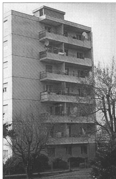
Ci-dessus : balcons «fourre-tout»

Avant tout, il faut que les dimensions et la forme de ces espaces soient de nature à les rendre non seulement utilisables, mais «habitables». Ils doivent être orientés du côté le moins bruyant, bénéficier de l'ensoleillement, ou du moins d'une bonne lumière à certaines heures, et, pourquoi pas, d'une vue de qualité. La «vue imprenable sur le lac» ou sur tout autre élément pittoresque qui se «loue», est certes un atout. Néanmoins, elle ne constitue pas une condition sine qua non au bon usage des ces lieux, si les autres critères sont remplis.