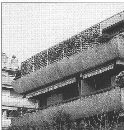
Ci-dessous : recherche d'intimité

- la contiguïté et l'alignement des balcons ou le «saucissonnage» d'un seul balcon-coursive entre les appartements qui le longent, n'offre pas beaucoup d'intimité à ses occupants ; ceux-ci vont parfois renforcer les séparations - avec un meuble par exemple - pour les rendre plus «étanches» et s'isoler phoniquement les uns des autres.