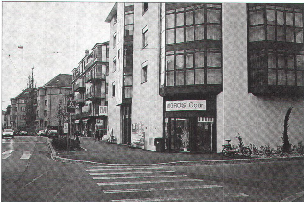
immeuble MMM présentant un pignon fermé à la rue