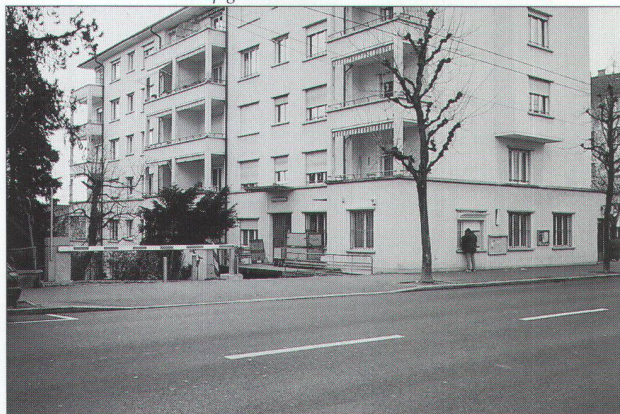
immeuble d'habitation avec pignon sur rue et le bureau de la Poste au rez