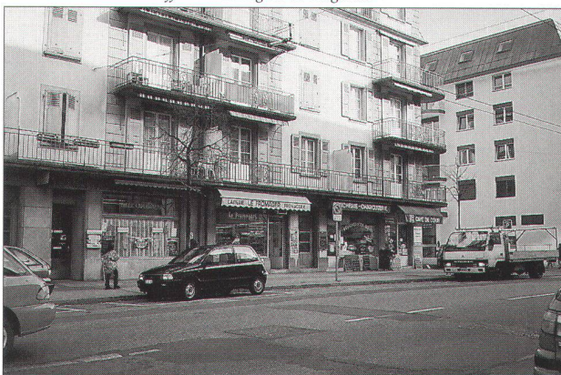
immeuble d'habitation offrant une alignée de magasins