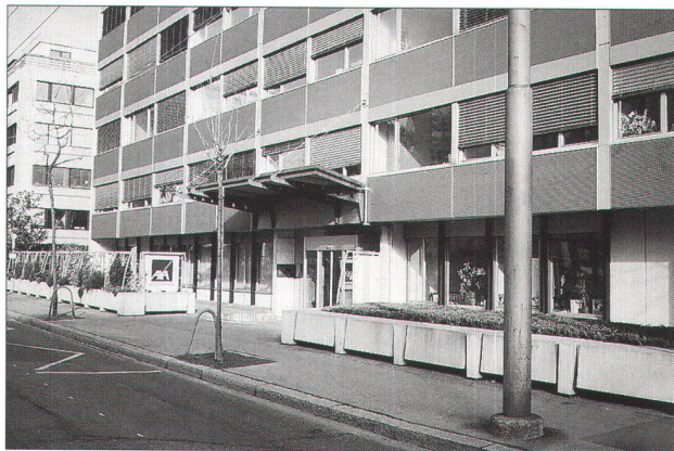
immeuble de bureau séparé de la rue par un ensemble de bacs