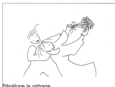
Pénélope le rattrape