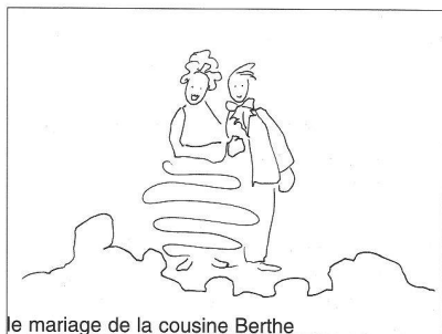
le mariage de la cousine Berthe