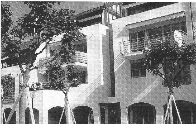
La place et les locaux communautaires

Ces valeurs assez récentes - 1997 - donnent un clair avantage aux habita-