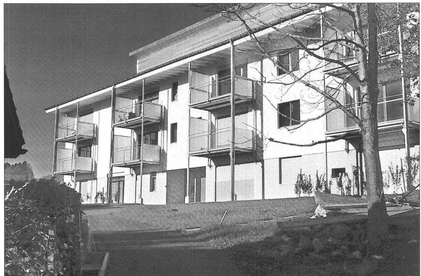
Ci-dessous : la façade et les balcons rapportés

Le détour par la fédération jurassienne qui se développa de façon spectaculaire dans cet arc horloger qui va de Soleure à Neuchâtel en passant par « les hauts » du canton de Neuchâtel et les régions voisines n'est donc ni fortuit, ni gratuit. Il explique et anticipe ce qui ne peut se limiter, étant donné