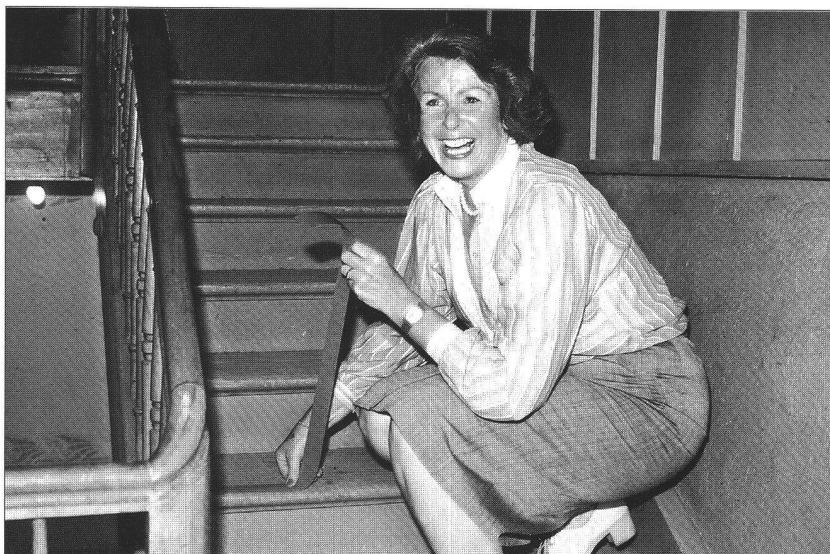
Une bande anti-gliss prévient les chutes dans les escaliers

Favoriser la cohabitation des générations, c'est prévoir les besoins qui apparaîtront ultérieurement (réaffectation des surfaces, protection acoustique), administration centralisée (coopérative de locataires) et encourager l'initiative des habitants.