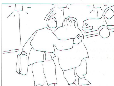
Départ à l'hôpital sur les chapeaux de roue