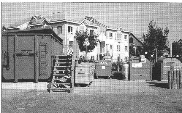
La déchetterie : nouveau théâtre de rencontres