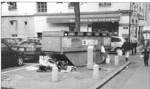
Une forme de récipient mal adaptée à la situation