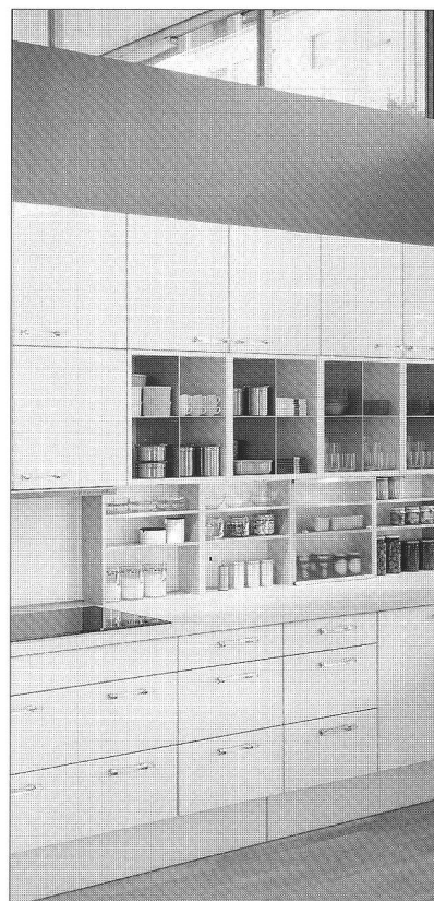
Ordre visible

Dans l'habitation collective, il faut convenir que le développement et le niveau de vie ont, pour corollaire, la multiplication des objets, des ustensiles et autres gadgets ménagers; la prolifération des appareils d'écoute et de reproduction du son, la diversité des moyens de nettoyage et d'entretien, de conservation, l'importance des soins corporels et des activités sportives, les jeux, jouets et véhicules des enfants et adolescents, la diversité de l'habillement et du linge de maison, les choix multiples des contenants, emballages occasionnels et les déchets qu'ils induisent influent sur les activités de la famille qui requièrent, de ce fait, de plus en plus d'espace d'entreposage et de stockage ou