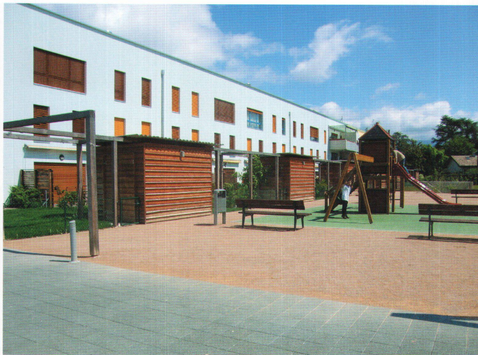
Cet ensemble harmonieux de 48 logements, dédiés principalement aux familles, valorise les espaces verts et de jeux.

Continuer à approvisionner le secteur des logements sociaux, maintenir et adapter leur patrimoine aux standards de qualité contemporaine sont des tâches que relève avec dynamisme et volonté l'équipe dirigeante. Près de 223 nouveaux logements sont actuellement en phase de réali-