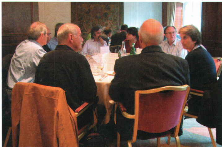
Après l'apéro, l'heure est à la bonne chère et aux belles tablées.

d'action pour le logement). Cette fédération regroupe les trois associations faitières de maîtres d'ouvrage d'utilité publique en suisse, ASH, ASCP-SWE