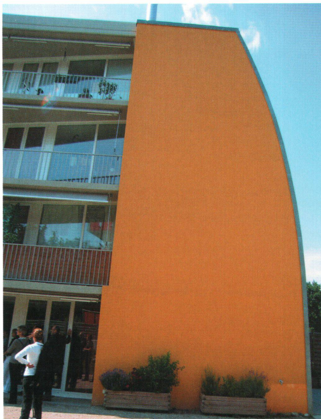
Cet immeuble de la coopérative INTI, en régime HM, compte 19 logements répartis selon 6 typologies différentes. Sa façade a été incurvée pour gagner en surface d'habitation au sol, tout en respectant la distance légale qui sépare le bâtiment de ses voisins.

Texte: Roger Dubuis , secrétaire général de l'ASH romande