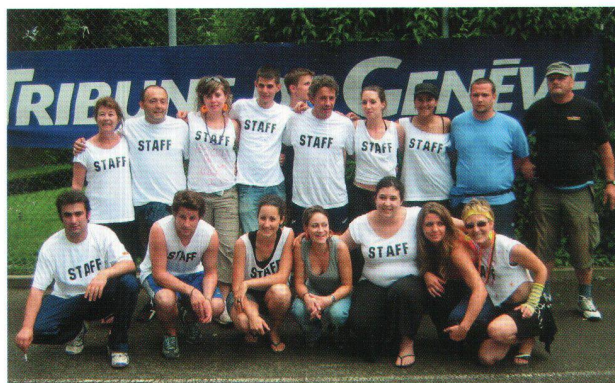
Les organisateurs du tournoi.