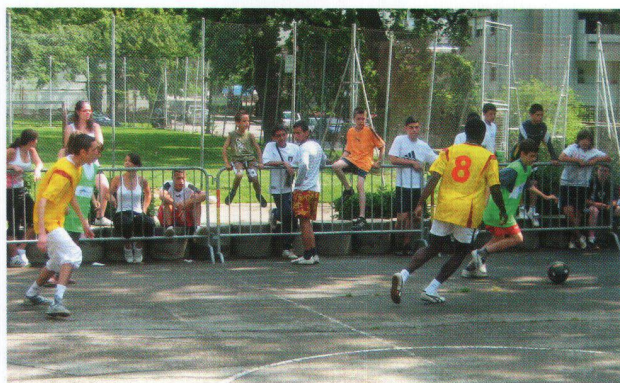
En plein match.