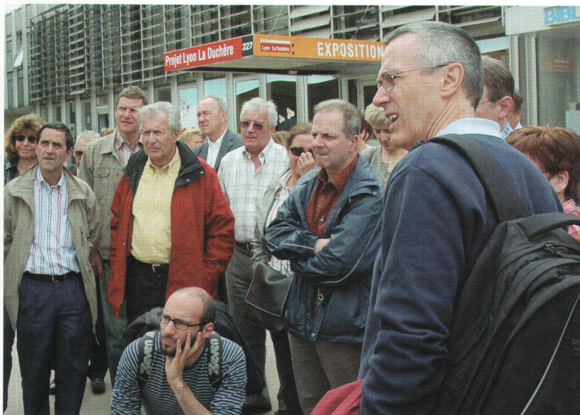
Des participants très attentifs lors de la visite du site Lyon la Duchère.

Le GPV la Duchère, c'est aussi améliorer le cadre de vie, par l'aménagement d'espaces verts, d'espaces de jeux, par le remplacement de mobilier urbain, par la création d'équipements publics: écoles, centres sociaux, garderie, bibliothèque, services publics, etc. La production de surface d'activité, commerciale et économiques fait partie intégrante du concept global. Il s'agit d'améliorer l'attractivité du quartier pour les entreprises afin de développer l'activité économique, créatrice d'emplois. Deux villages d'entreprises ont ainsi été initiés, les conditions cadres sont réunies pour engager efficacement ce processus. Le projet d'aménagement urbain du quartier valorise les qualités paysagères du site, améliore les liens entre la Duchère et son environnement et crée un centre de quartier. La Cité de la Duchère se transformera dans quelques années en Centre la Duchère. Le calendrier des travaux et les budgets prévision-