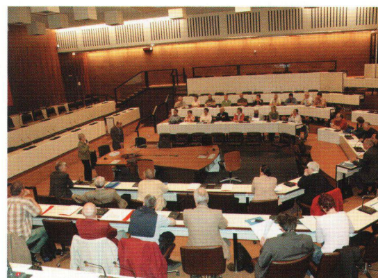
Présentation de la politique de l'habitat.