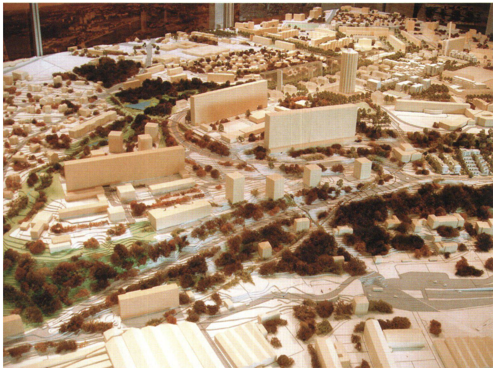
La maquette du grand projet de la Duchère.

universel en Occident. La construction de 6150 logements par an de 1999 à 2006, dont 2644 logements sociaux pour l'année 2006, ne suffit pas à combler la pénurie actuelle.