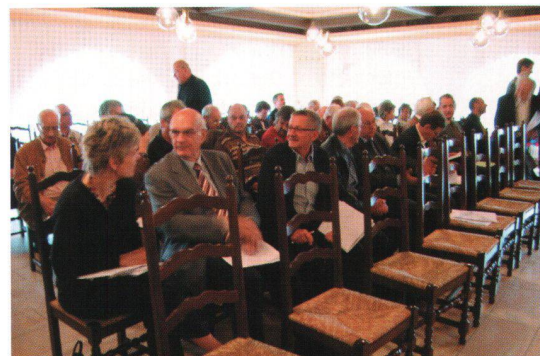
Les membres de l'ASH romande lors de l'AG à Yverdon-les-Bains.

La section romande devait également nommer pour une nouvelle période législative de 3 ans ses repré-