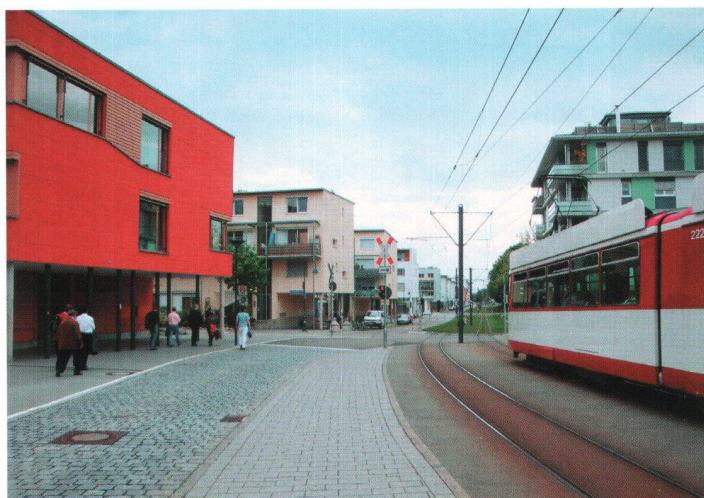
Vue sur l'entrée du quartier de Vauban, avec le tram qui relie l'écoquartier au centre-ville.

Qui sont-ils? Comment vivent-ils? Comme le relève Jürgen Hartwig (architecte-urbaniste, guide du quartier), «les premiers habitants, ceux qui ont dès le début occupé le site et qui se sont regroupés au sein de l'association Forum Vauban, sont convaincus des bienfaits de vivre dans un tel quartier». En tant que co-concepteurs du projet, ils partagent et portent les aspirations écologiques et communautaires à l'origine du projet. La majorité des quelque 5000 habitants actuels du quartier sont venus plus tard, avec les groupes de construction. Depuis 10 ans, leur arrivée s'est faite de manière progressive. Les nouveaux habitants se sont pour la plupart très bien intégrés au mode de vie de Vauban. Leur participation à la