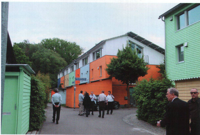
Visite de la Cité solaire, avec ses «plus energy houses», conçues par l'architecte Rolf Disch.

Le quartier de Vauban s'est développé en marge du centre ville, à l'intérieur du tissu bâti existant, sur une ancienne friche militaire désaffectée et occupée dès le départ par un groupe d'habitants à la recherche d'un logement en ville. Issu d'un processus négocié (et parfois conflictuel) avec la ville, le projet a été élaboré sur un