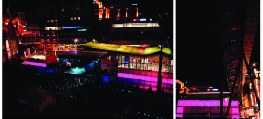
Installation urbaine / Label Suisse & M2 / Lausanne 2008.

Installation vidéo & lumière pour la piscine d'un chalet de luxe en Valais 2008. Architecte intérieur: Adeli & De Rahm / Lausanne-Dubaï.