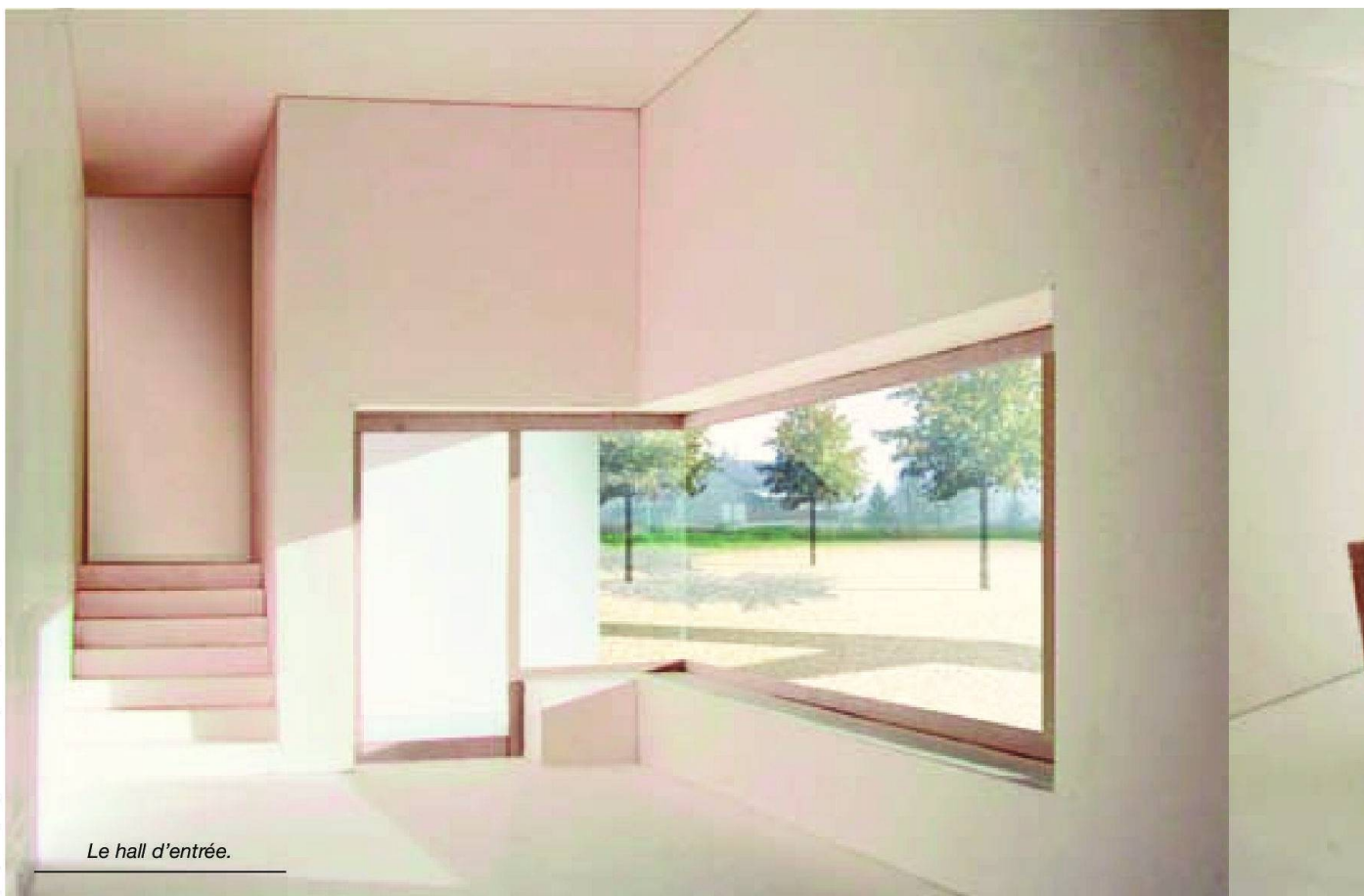
Le hall d'entrée.

L'autorisation de construire est arrivée à la commune le 20 mars dernier; la demande avait été déposée en août 2008. De son côté, le Conseil communal a voté le crédit d'investissement nécessaire. A l'unanimité. Du côté des finances communales, on a veillé à ce que l'opération ne paralyse pas tout futur projet, pour cause de surendettement. «Dans la réflexion, nous avons pris garde de toujours maintenir des finances saines afin que les futures autorités conservent une marge de manœuvre pour des projets à venir» explique le maire.