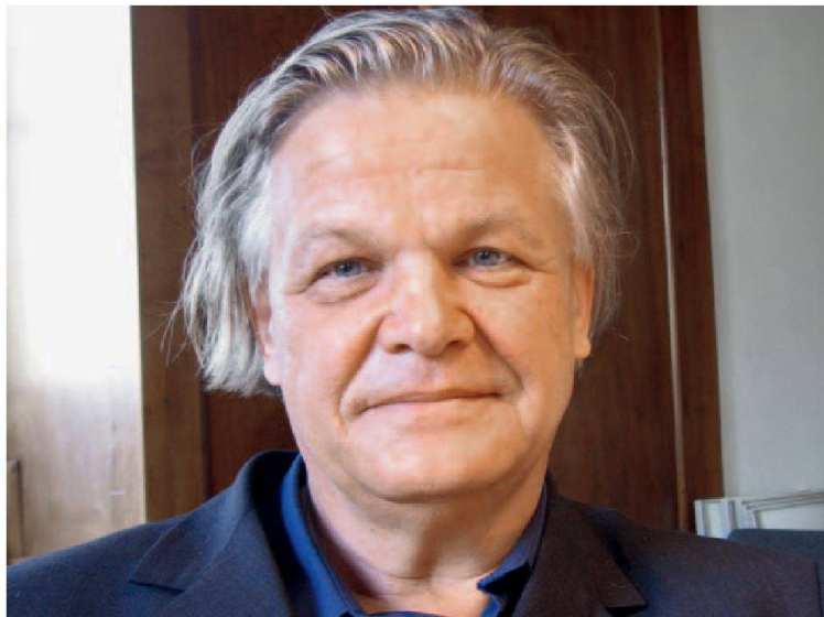
Miroslav Šik.

L'architecture est trop souvent réduite à sa seule conformité avec les normes de construction en vigueur;