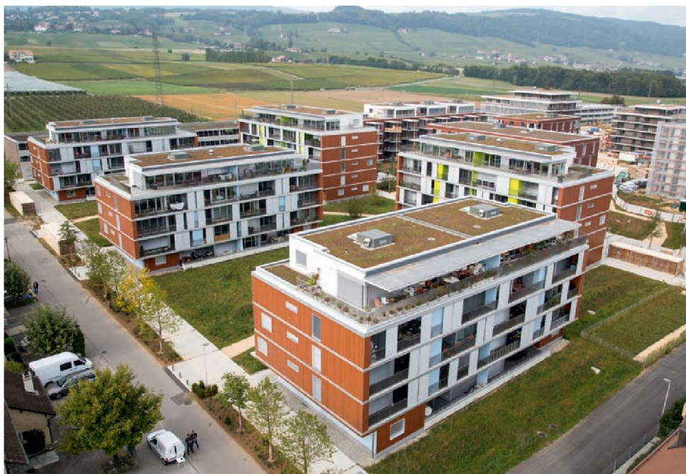
La partie ouest du quartier est déjà achevée. © DR