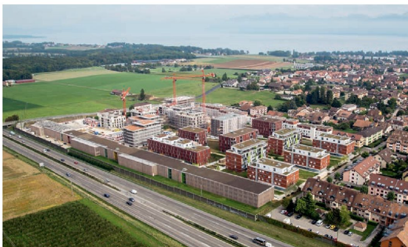
L'écoquartier Eikenott en 2013.

La commune de Gland comptera bientôt 1200 habitants de plus. Ils auront la chance de pouvoir vivre dans le nouvel écoquartier Eikenott: développement durable et qualité de vie en sont les maîtres-mots. Ce projet futuriste est devenu réalité: les premiers habitants viennent d'emménager. Il sera entièrement terminé à la fin de cette année.