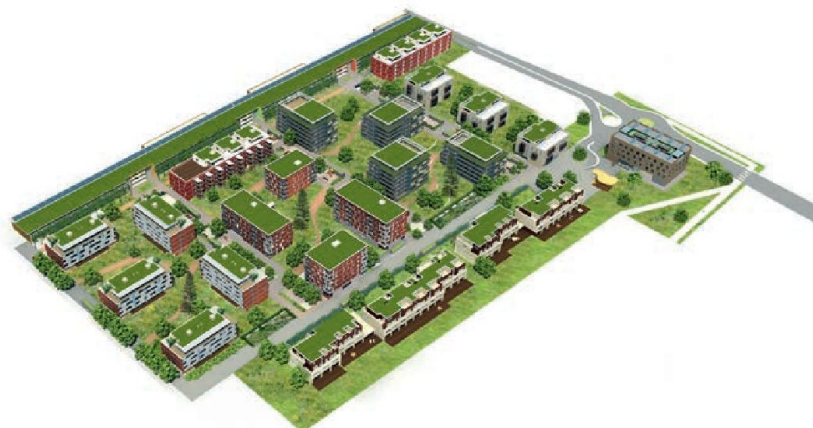
L'axonométrie du quartier en entier.

Pour parler de «quartier durable», il faut pouvoir satisfaire à plusieurs critères. La mobilité douce signifie que les gens peuvent se déplacer à pied ou à vélo (un abri-vélos par bâtiment, 800 places de vélos) et les voitures en sont bannies. Tous les bâtiments ont été labellisés Minergie-Eco: non seulement le standard Minergie est respecté, mais en plus, les matériaux utilisés doivent pouvoir être réutilisables en cas de démolition. Les panneaux solaires qui recouvrent le toit du grand parking extérieur permettent de produire de l'eau chaude sanitaire en été, tout en fournissant aussi une partie de l'électricité nécessaire au fonctionnement de la centrale de chauffage à bois. Ce système de chauffage à distance permet de chauffer tout le quartier. Tout le bois brûlé provient des forêts avoisinantes