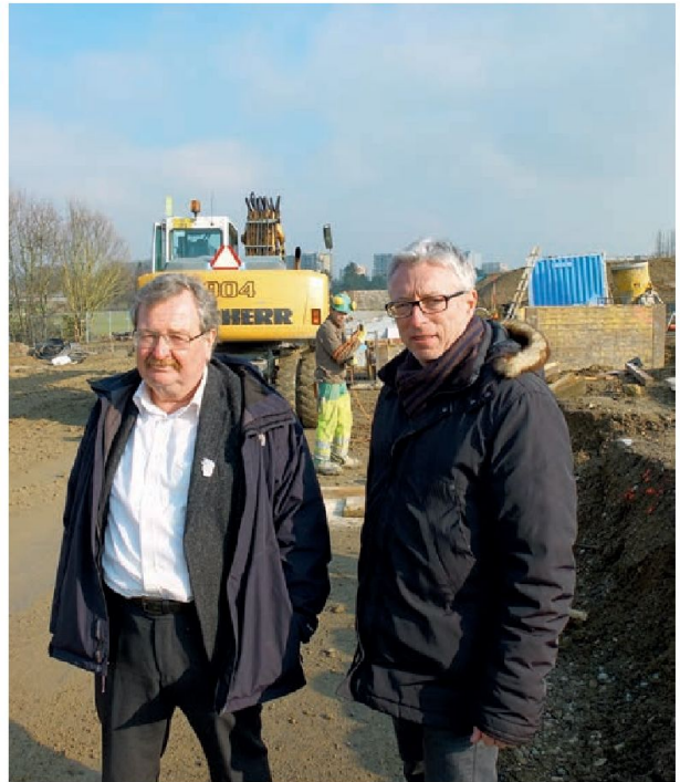
Petit tour sur le chantier.

Comme nous voulons que ce nouveau quartier s'intègre dans la ville existante et aie des liens avec tous les résidents de la commune, il est donc légitime et logique de les impliquer, indépendamment du fait qu'ils iront y vivre ou non.» L'intégration du nouveau quartier passe donc par une bonne anticipation d'un lien avec le reste de la ville, et dans cette optique, les rez-de-chaussée des immeubles des Vergers, dévolus aux activités associatives, artisanales et commerciales, joueront un rôle très important. L'idée étant que ces activités ne répondent pas uniquement aux seules activités d'autosuffisance et de services de proximité du quartier, mais y attirent tous les Meyrinois, histoire de brasser une bonne partie des 22 000 habitants avec les 3000 nouveaux attendus.