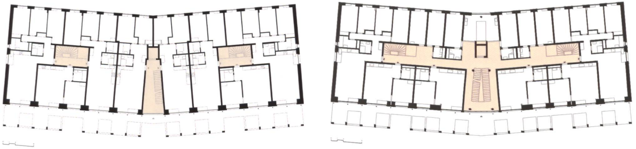
Plan du 1 er étage (g) L'ascenseur ne dessert que les appartements du milieu. L'accès aux autres appartements est possible par les passerelles. Au 3 e étage (d), la «rue intérieure» met en relation l'ascenseur et les cages d'escaliers situées à l'Est et à l'Ouest. DR