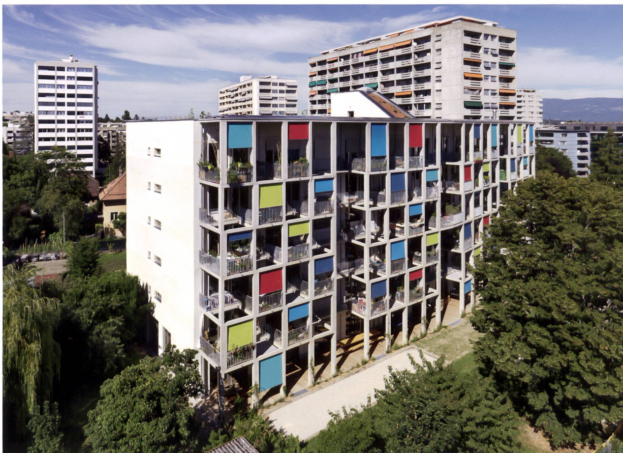
Les livings donnent sur le Sud. Les espaces laissés entre les balcons assurent un supplément de luminosité aux appartements.