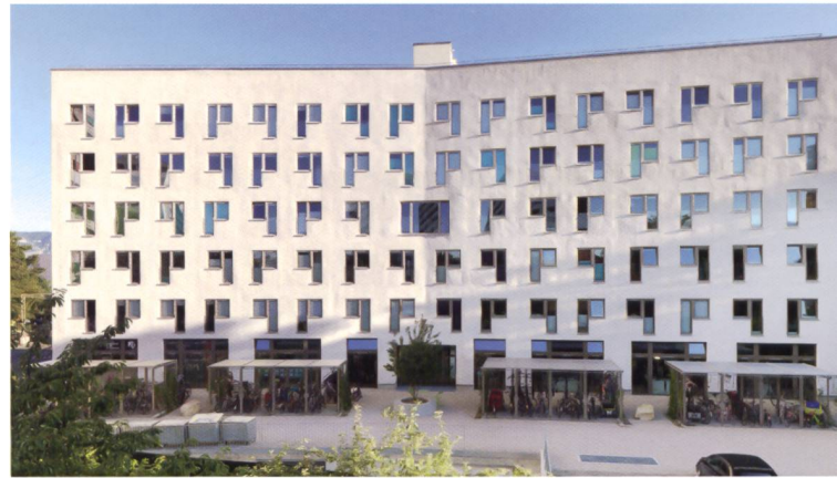
La position des ouvertures de la façade Nord a donné lieu à de longues discussions entre coopérateurs et architectes.