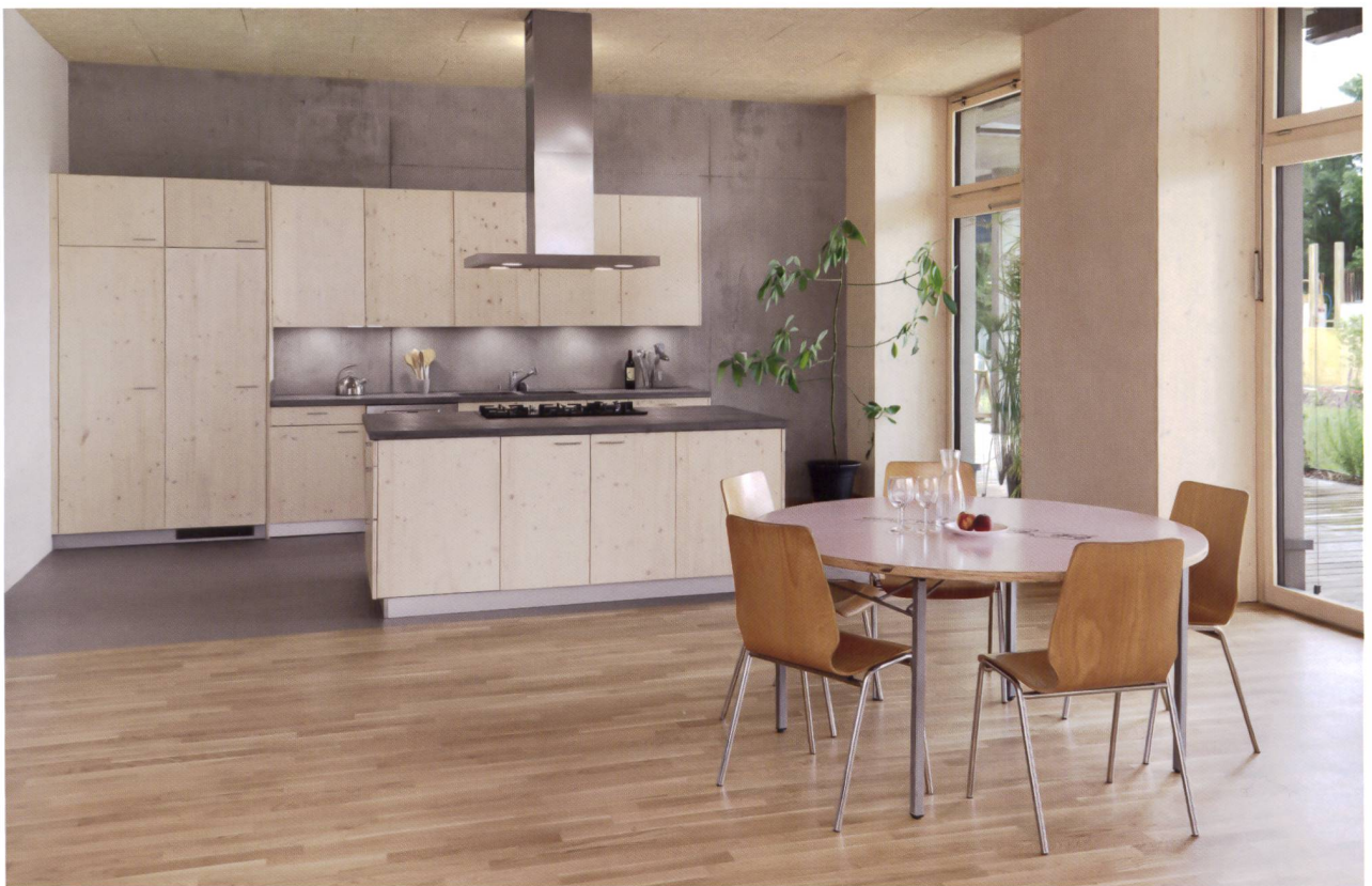
La grande salle commune.