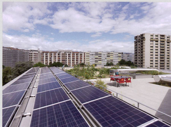
Les panneaux solaires se partagent l'espace du toit avec une terrasse et un potager communs.

Si tout le monde n'est pas devenu membre d'EnerKo, en revanche, par décision des conseils d'administration d'Equilibre et de Luciole, les habitants sont membres de la communauté d'auto-consommateurs. «Cette appartenance apparaît comme une annexe au bail. De facto, un habitant aurait pu refuser, mais le cas ne s'est pas présenté», poursuit le co-RMO. Au début de l'été, des négociations étaient encore en cours avec les SIG à propos du type de contrat les liant à la communauté d'autoconsommateur, qui souhaiteraient être contractuellement liées à un représentant de la communauté d'autoconsommation. L'installation, dont la conception et l'installation s'est élevée à quelque CHF 60 000, a bénéficié d'une subvention fédérale de CHF 16 390. Elle produit un kWh à 22 ct (hors TVA), soit l'équivalent du prix du kWh SIG Vitale bleu mais de qualité SIG Vitale soleil (100% solaire) à 34 ct (hors TVA). VB