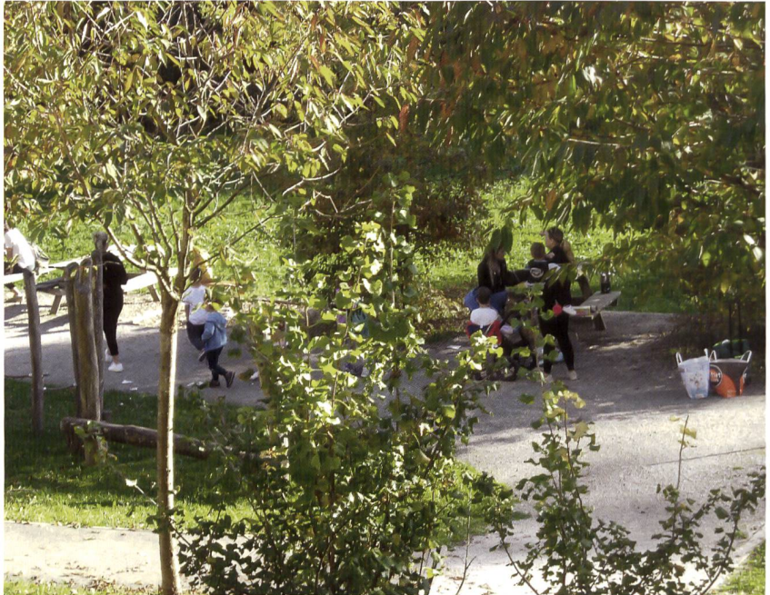
La place de jeux est très prisée des enfants. Des tables et bancs permettent de faire de joyeux pique-niques!

Mais, avant que la pose de la première pierre ne puisse se faire, bien des étapes ont dû être franchies et des obstacles surmontés. Un plan de quartier a été élaboré pour la partie du Mont-sur-Lausanne de la parcelle. La