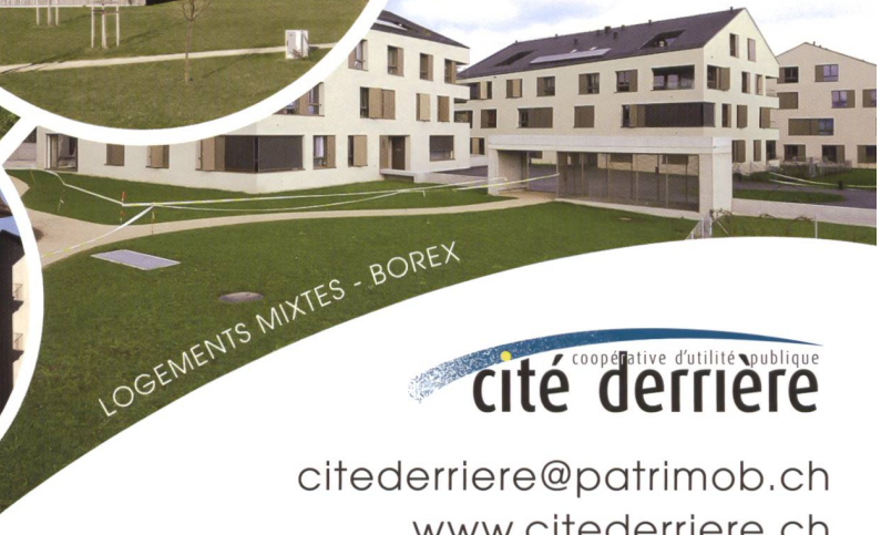
LOGEMENTS MIXTES - BOREX