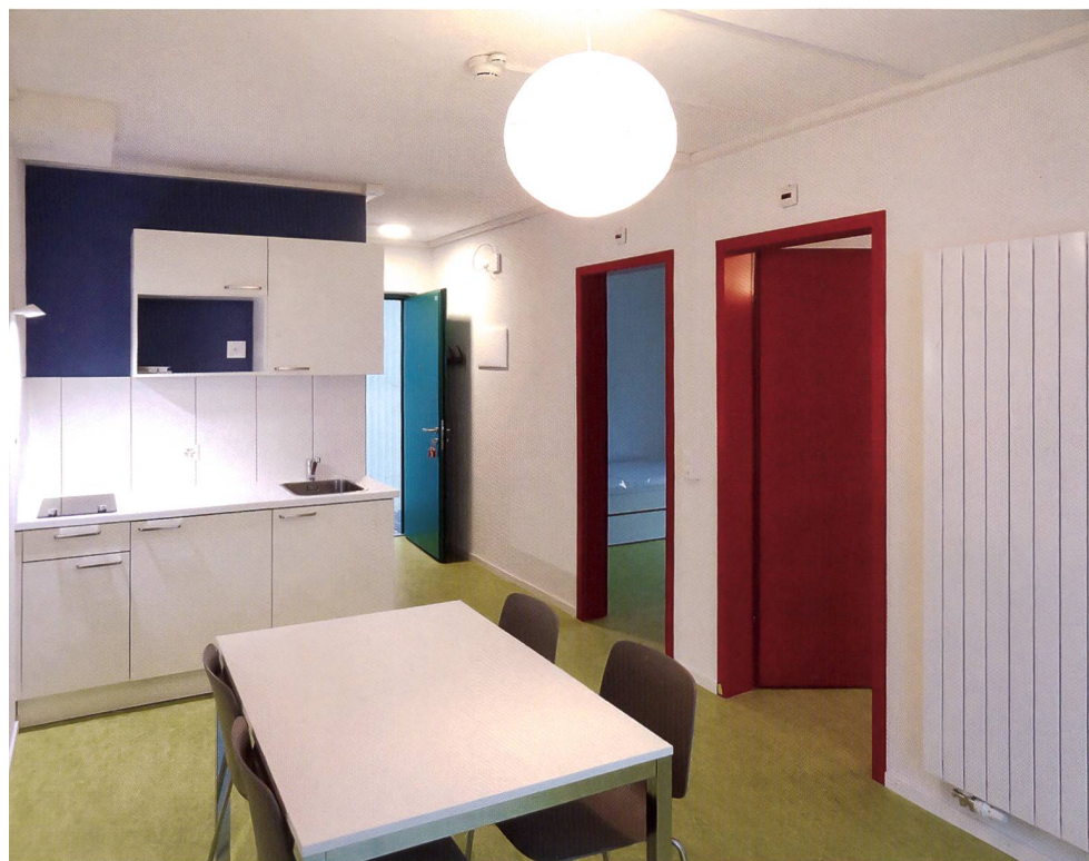
Cuisine et salle à manger

En ce qui concerne l'aspect de l'intendance/conciergerie, un intendant a