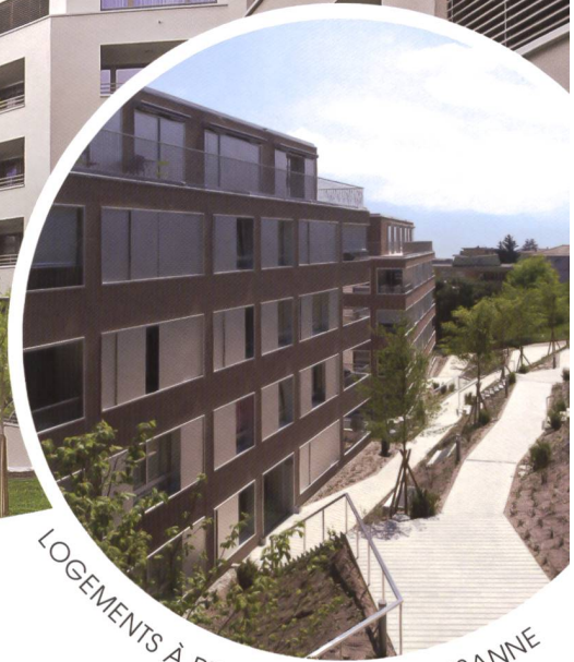
LOGEMENTS À PRIX COÛTANT - LAUSANNE