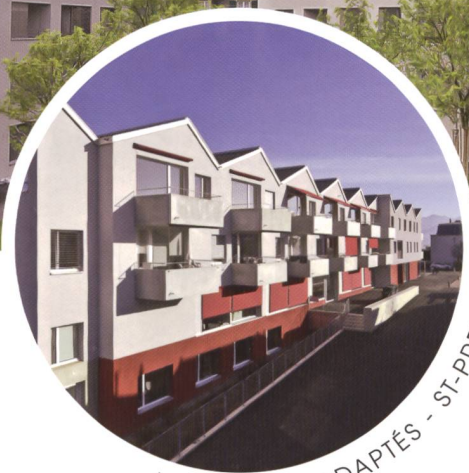
LOGEMENTS ADAPTÉS - ST-PREX