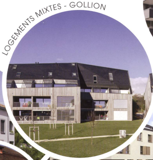
LOGEMENTS MIXTES - GOLLION