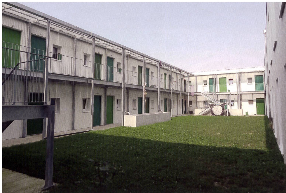
La cour intérieure

été nommé. Il est présent la journée, et remplit différentes tâches de maintien de l'immeuble, mais il n'est pas là pendant la nuit. Des alarmes incendies ont été installées, afin que les locataires