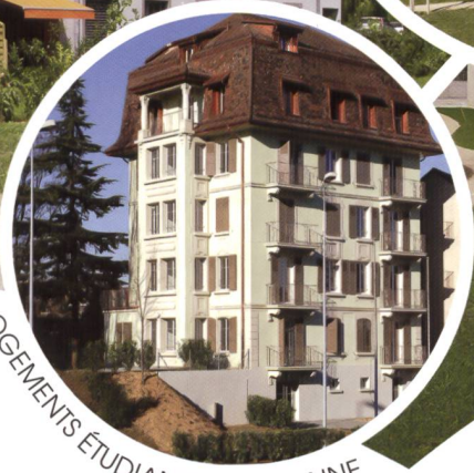
LOGEMENTS ÉTUDIANTS - LAUSANNE