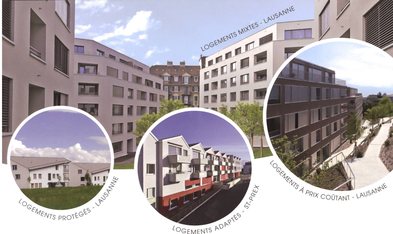
LOGEMENTS MIXTES - LAUSANNE