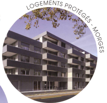
LOGEMENTS PROTÉGÉS - MORGES