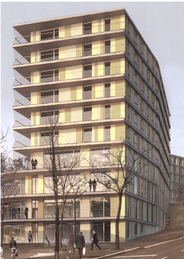
SILL et SCILMO construisent 194 logements à la rue de la Sallaz. MPH architectes/DR

Passons aux bonnes nouvelles. Quel rabais sur sa facture d'électricité le consommateur peut-il espérer? Il est sans doute plus aisé de répondre à cette question à l'heure où ce magazine est publié. Car au moment où cet article est rédigé, chacun était encore dans l'attente de la nouvelle Loi (fédérale) sur l'approvisionnement en électricité (LAPeI), qui doit entrer en vigueur le 1 er janvier 2018, et dont les ordonnances auront un fort impact sur la mise en place des projets d'autoconsommation tels que celui des Falaises.