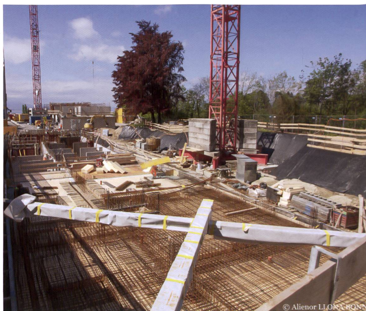
Le site est situé sur un terrain étroit, entre la rue de la Sallaz et les Falaises.

Du côté des maîtres d'ouvrage, rencontrés au début de l'été, si le développement du projet se vivait davantage dans le voyage que dans la destination, l'évocation de la