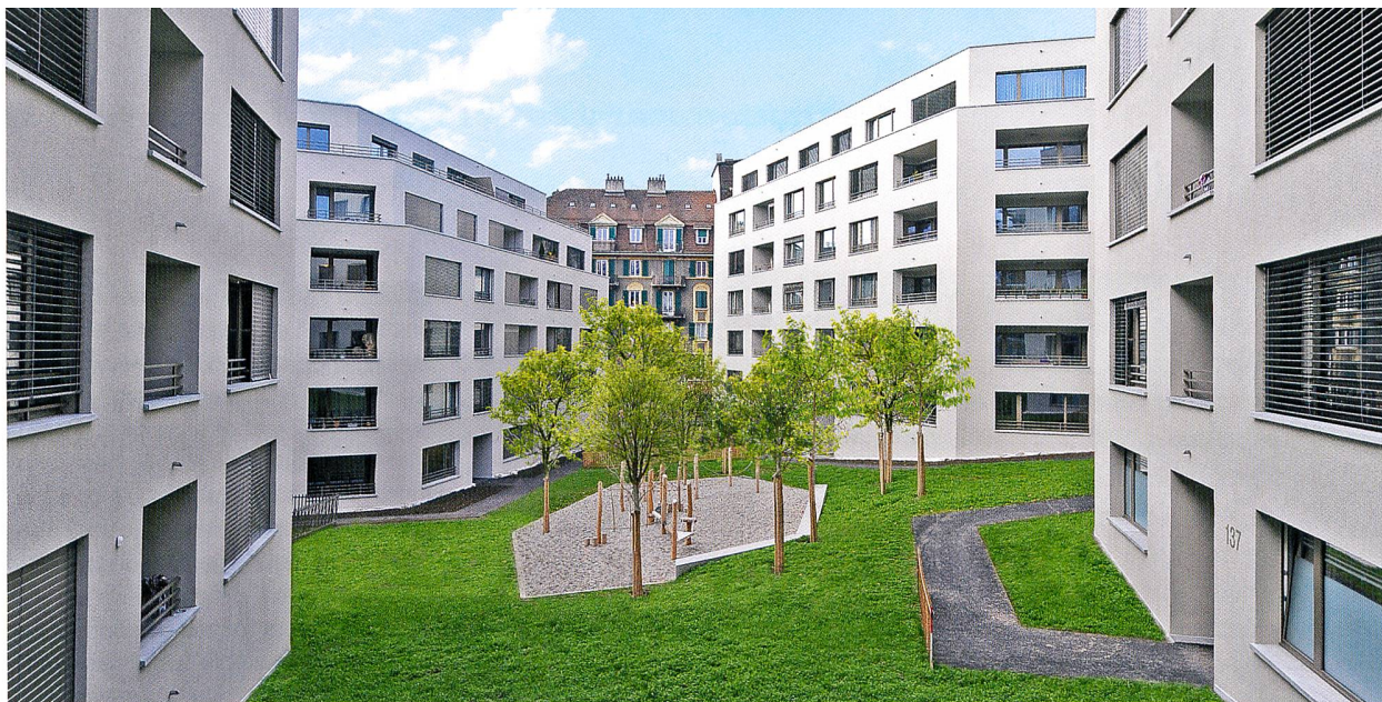
Quartier Sirius à Lausanne (4 immeubles de logements protégés/mixtes à l'avenue de Morges 139).

aussi avoir leurs animaux de compagnie. Mais ces locataires bénéficient aussi, en plus de la salle communautaire déjà décrite, d'un encadrement très apprécié: la présence à mi-temps d'une animatrice socio culturelle diplômée appelée la référente sociale (ou de maison). Sa responsabilité est d'être à l'écoute des locataires et de voir s'ils vivent bien ou ont besoin d'aide, ainsi que d'organiser les activités de loisirs. Pour les locataires, cette présence de la référente sociale est un gage de qualité de vie et, surtout, de sécurité (chaque locataire peut, s'il le souhaite, s'équiper d'un kit d'alerte pour ses proches ou les urgences).