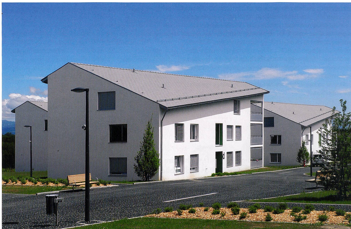
Site de Pra Roman (Vers-chez-les Blancs, Lausanne).