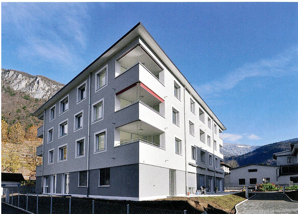
Trois immeubles Minergie (logements protégés) du site Campagne Emmanuel à Aigle.

Dans ses immeubles avec des logements protégés, la Coopérative Cité Derrière considère ses habitants comme des locataires tout à fait autonomes: chacun dispose d'un contrat de bail, d'une clé d'appartement et d'une boîte aux lettres. Ils peuvent