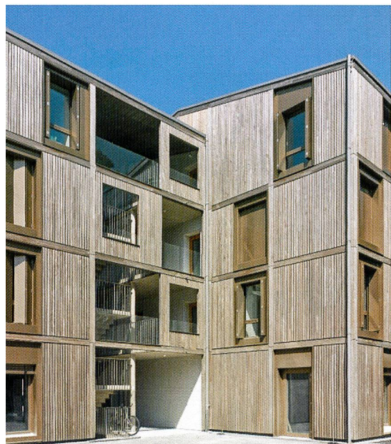
Les nouvelles réalisations (Rigaud, par la Codha, inauguré ce printemps) visent des consommations toujours moins importantes.

mal, et finalement, finissait par augmenter la température, et donc la consommation.» De guerre lasse! Et chacun d'espérer un nécessaire temps d'adaptation de quelques années plutôt que d'une génération.