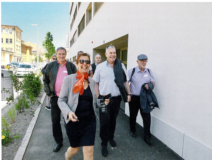
L'ARMOUP visite l'écoquartier Le Corbusier après son AG.

Le plan spécial du quartier Le Corbusier a été reconnu par l'ARE (Office fédéral du développement territorial) en tant que «projet modèle de quartier durable» grâce à sa triple mixité: sociale, intergénérationnelle et fonctionnelle. En effet, ce quartier est notamment caractérisé par la mixité des logements proposés. On y compte 19 appartements protégés (labellisés «avec encadrement» mais ce ne sont pas des «LUP» dédiés aux personnes âgées, 12 appartements en PPE, et 36 logements «LUP» de la Coopérative. Sur ce même site a été construit un immeuble pour l'Office cantonal d'assurance-invalidité (AI) du canton ainsi que pour l'ORIF (une institution cantonale spécialisée dans l'intégration et la formation des assurés bénéficiant de l'AI). C'est en mars 2014 que les travaux ont débuté. Et les premiers locataires ont pu emménager dès le