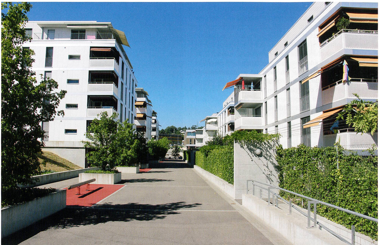
Maillefer 117, rue piétonne.

Il varie de cas en cas. Selon la loi, la coopérative peut attendre jusqu'à trois ans avant de rembourser les parts sociales. Le montant remboursé dépend de la situation financière de la coopérative qui le limite souvent à la valeur nette du bilan. Les grandes coopératives, comme la SCHL, remboursent le montant des parts sociales immédiatement. On peut dire que plus grande est la coopérative, plus la possibilité d'un remboursement rapide est bonne.