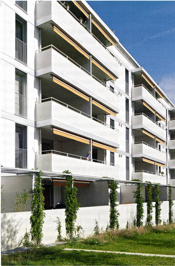
Le quartier de Maillefer.

Ainsi, pour prendre l'exemple de la SCHL dont j'ai été le directeur pendant 22 années, elle remboursait immédiatement les parts sociales aux locataires partants. Le délai de remboursement doit être fixé dans les statuts de la coopérative, afin d'éviter tout problème. Le remboursement peut être problématique si les parts sociales liées à un logement représentent un montant élevé.