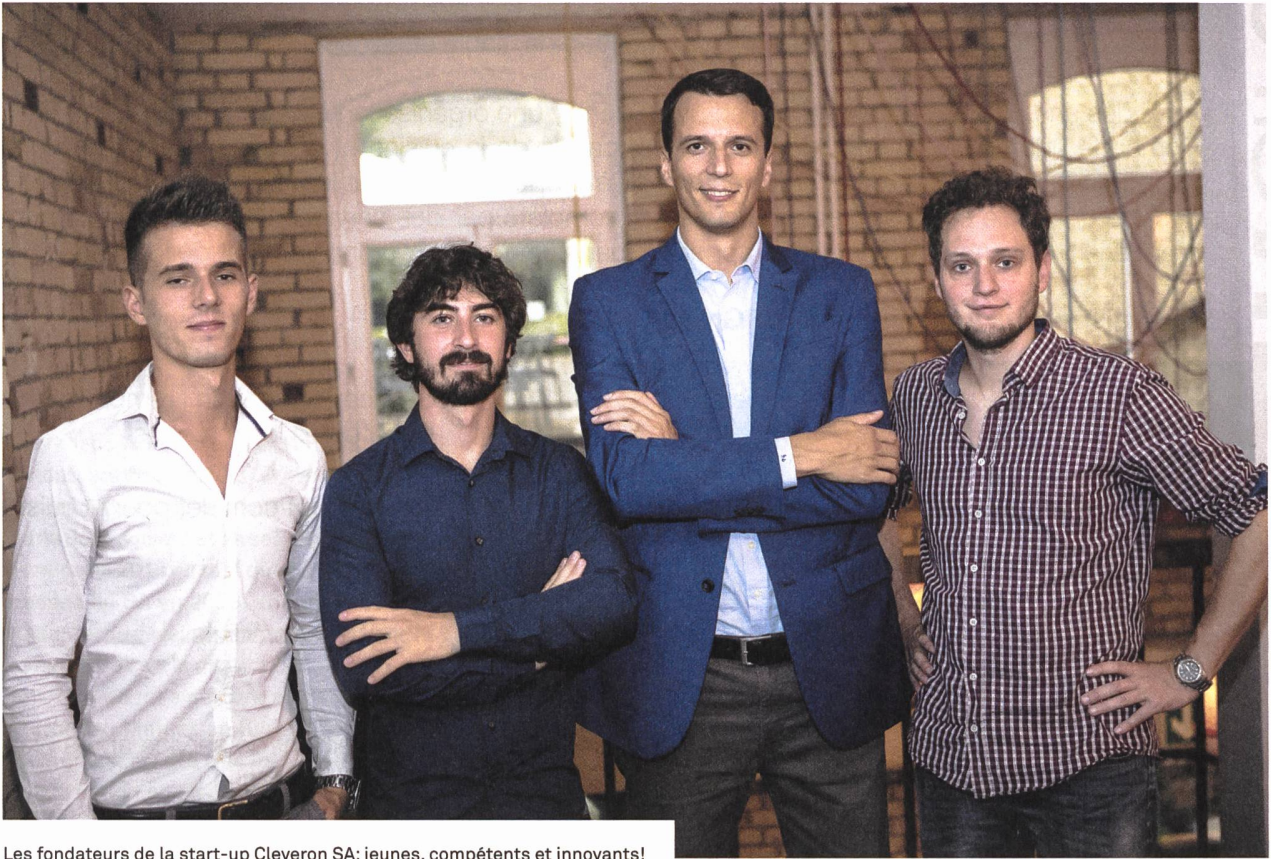
Les fondateurs de la start-up Cleveron SA: jeunes, compétents et innovants!