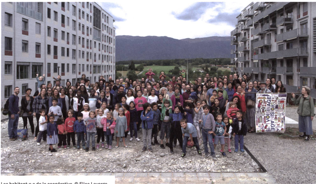
Les habitant·e·s de la coopérative.

sur plusieurs étages. Ensemble, les futurs habitants décident d'y aménager un mur de grimpe, une serre, une salle des fêtes, un atelier de bricolage, deux saunas en toiture, une salle de fitness, une salle de yoga et de danse, une bibliothèque avec des espaces de travail en mezzanine où tous les livres sont référencés, ce qui témoigne d'une belle participation pour l'aménagement des lieux. «Les coopérateurs·trices s'impliquent là où ils s'installent, c'est une source de bénévolat intarissable, précieuse pour les communes!» souligne Annick Hmidan-Kocherhans, secrétaire générale de Voisinage. Autogérés par les habitants·e·s sans distinction de provenance entre les deux coopératives, les espaces d'activités attirent beaucoup de monde, et aussi les adolescents. «Dans les nouveaux quartiers,