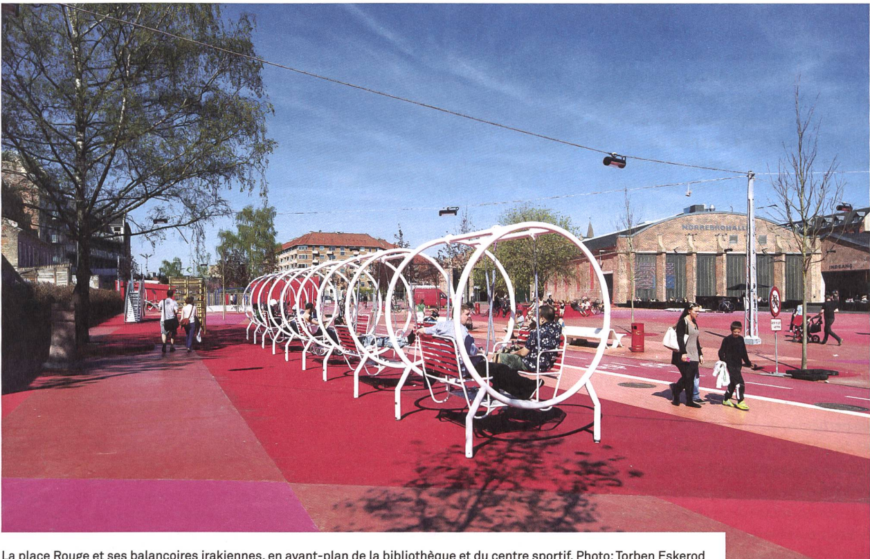
La place Rouge et ses balançoires irakiennes, en avant-plan de la bibliothèque et du centre sportif.

Au cœur du quartier urbain de Nørrebro, à Copenhague, la restructuration de l'espace public a métamorphosé ce quartier multiethnique en un lieu d'intégration. Dix ans plus tard, il est l'un des endroits les plus vivants de la ville.