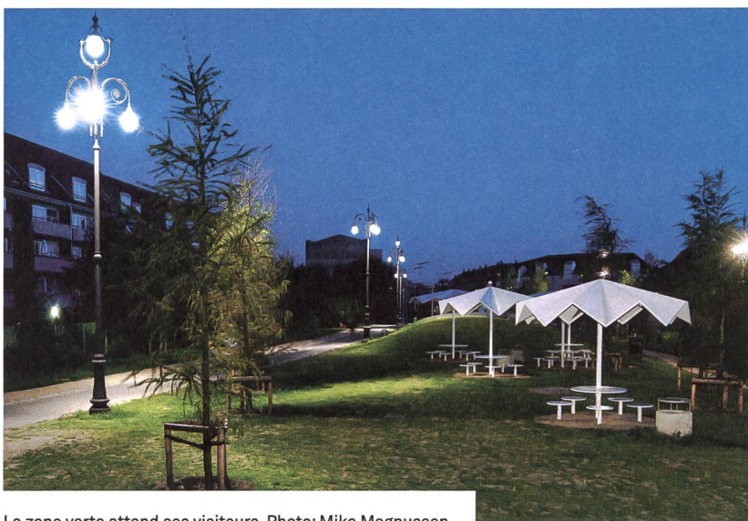
La zone verte attend ses visiteurs.

https://www.superflex.net/works/superkilen ■