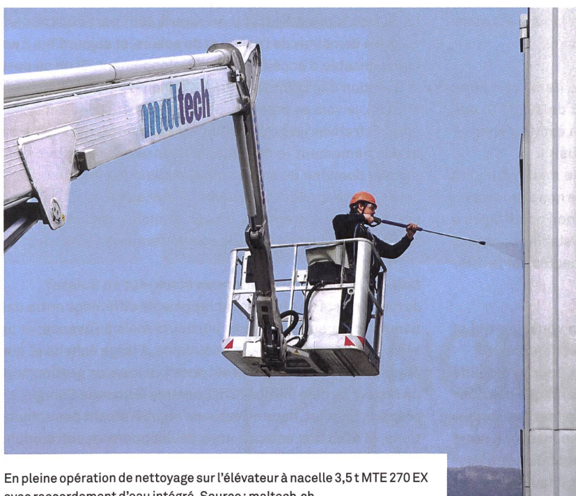
En pleine opération de nettoyage sur l'élévateur à nacelle 3,5 t MTE 270 EX avec raccordement d'eau intégré.

Je me souviens surtout de ces situations où l'accès à notre lieu d'intervention s'est avéré très, très compliqué. Par exemple dans la « cour de récréation » de la HEP Zurich. Ou dans l'atrium de la prison de district de Dietikon. Ce qui distingue ces interventions des autres, ce ne sont pas tant les missions en elles-mêmes, mais plutôt la manière dont Maltech a abordé la situation avec nous, en faisant preuve d'une incroyable ouverture d'esprit pour parvenir à des solutions innovantes. C'est ainsi que ce qui nous semblait impossible à prime abord, est devenu possible.