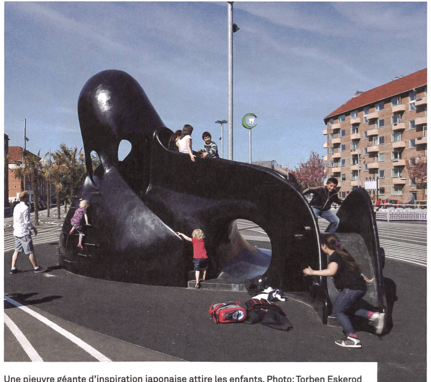
Une pierre géante d'inspiration japonaise attire les enfants.

Si cette réhabilitation profite à l'ensemble du quartier, elle comporte en même temps un risque de gentrification qui menace le caractère multiethnique et socialement modeste à l'origine du projet. En effet l'amélioration de la qualité de vie par l'espace public exerce une grande attractivité sur les investisseurs privés, intéressés à y développer l'habitat et le commerce.