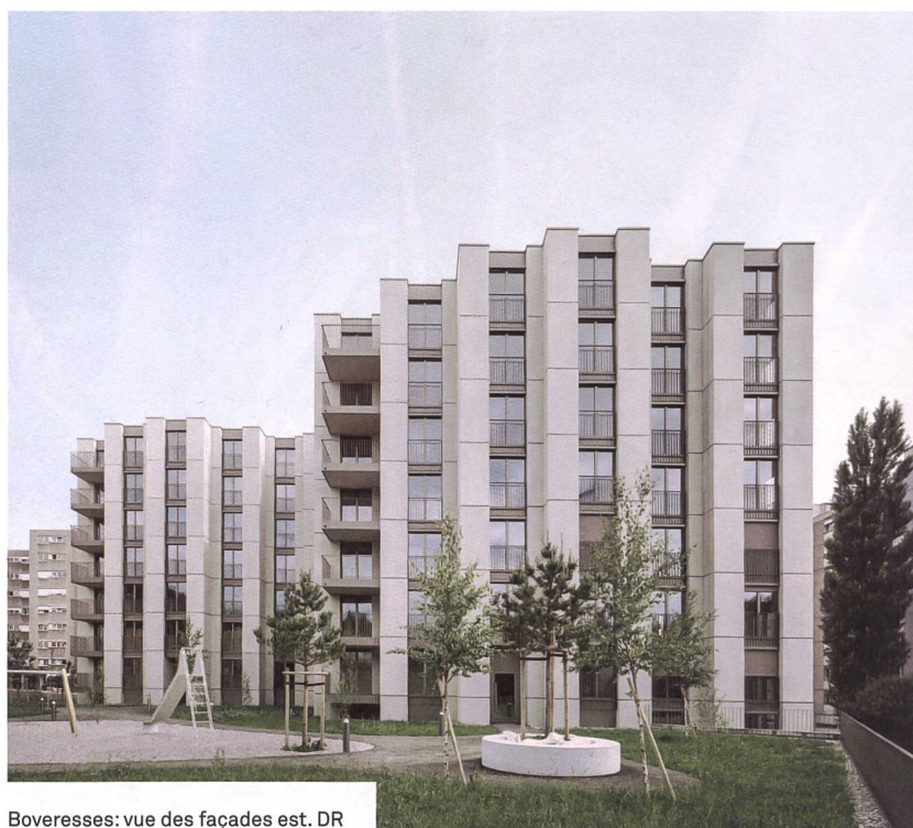
Boveresses: vue des façades est.