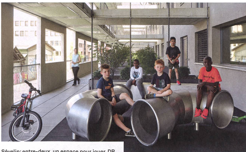
Sévelin: entre-deux, un espace pour jouer.

président de la coopérative. Ce dispositif ingénieux de double membrane permet à la fois de limiter le nombre de mètres carrés de plancher chauffé alloué aux distributions, et de stimuler les synergies entre usagers-ères. L'Exosquelette offre 70 appartements des 2,5 aux 4,5 pièces, répartis sur quatre niveaux et bénéficiant tous d'une double orientation. Le rez abrite entre autres le Service du travail de la ville de Lausanne, ainsi qu'un restaurant d'application ouvert au public et lié à ce dernier service.