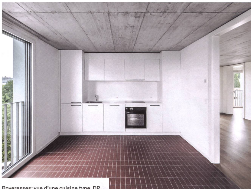
Boveresses: vue d'une cuisine type. DR