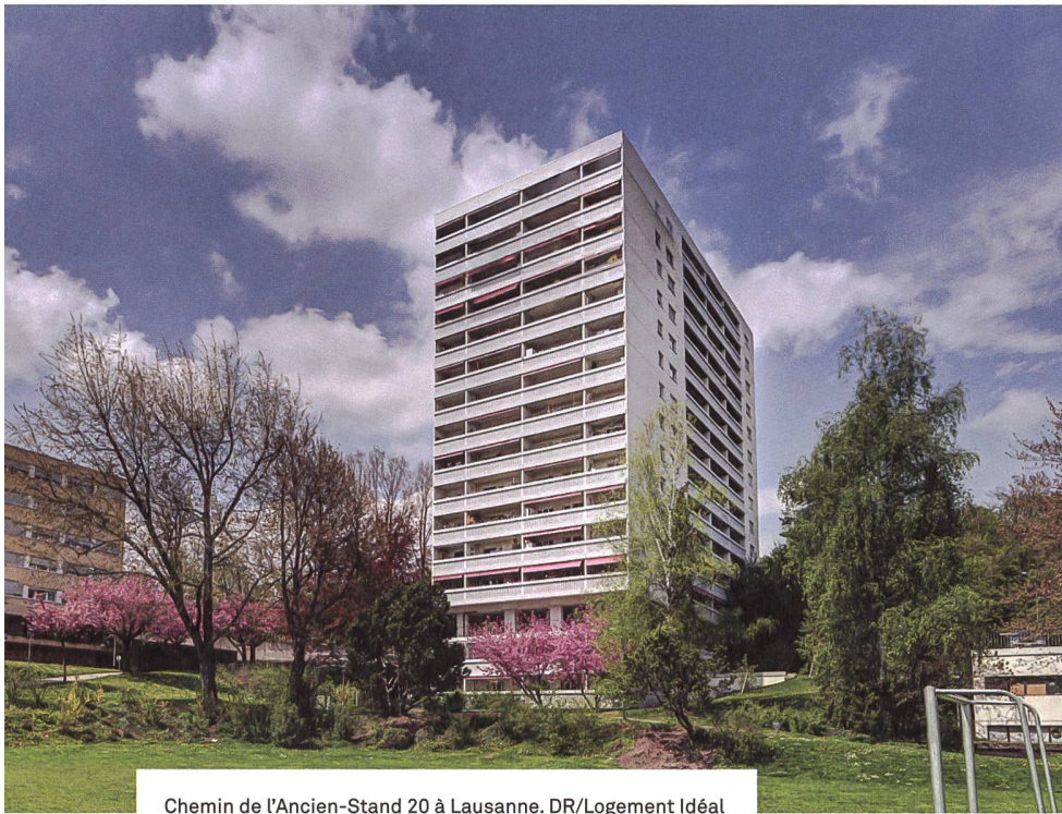
Chemin de l'Ancien-Stand 20 à Lausanne.