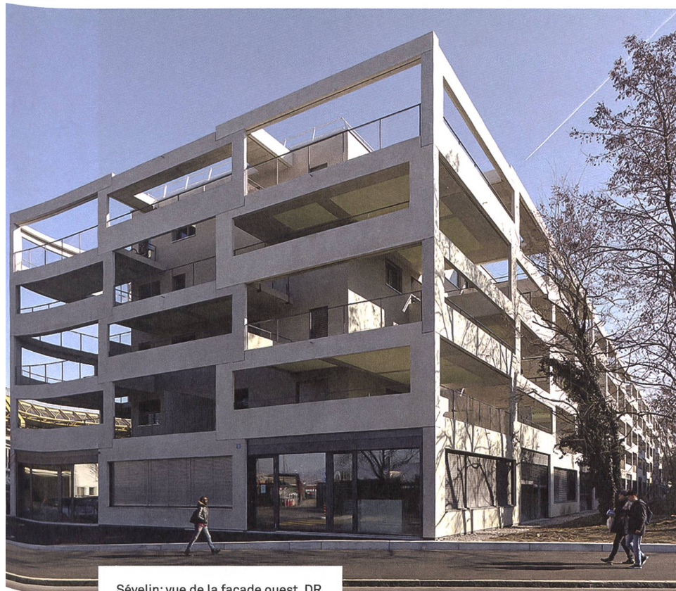
Sévelin: vue de la façade ouest.