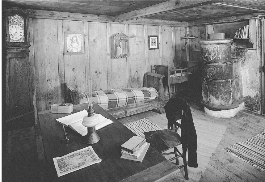
Abb. 3: Neben den klassischen Heimatmuseen, die vorab früheres Arbeiten und Wohnen festhalten (im Bild das Museum der Patois-Vereinigung in Villette/Le Châble) ...

auf landab – womit den Einheimischen nicht zwangsläufig Desinteresse vorzuwerfen ist. Den Bürgerinnen und Bürgern am Ort sind die dargestellten Themen oft aus eigener Anschauung bekannt. Wozu soll ein Einheimischer eine Ausstellung über landwirtschaftliche Arbeiten im Jahreslauf anschauen? Was dem Publikum Abwechslung und Information bietet, ist ihm zu Genüge bekannt. Aus der Sicht einiger Ortsansässiger liegt der Nutzen eines Museums vor allem darin, dass sie interessierte Gäste, lästige Schulklassen und fragende Fernsichtteams bequem an ein anerkanntes «Informationszentrum» verweisen können.