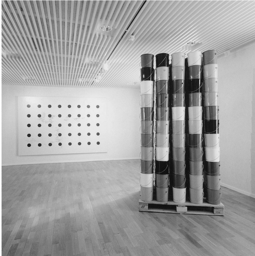
Abb.5: Avantgardistische Ausstellungen haben nicht nur im Bergkanton einen schweren Stand (kantonales Kunstmuseum Sitten, Ausstellung «Dialogues» 1997), ...