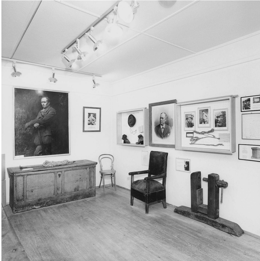
Abb. 1: Das gerissene Seil der Erstbesteigung unter Whymper als «unic-selling-proposition» wie das Matterhorn selbst: Jährlich besuchen um die 20'000 Personen das Alpine Museum in Zermatt, ohne dass dieses speziell um die Gunst des Publikums werben muss.

den. Das bei der Erstbesteigung des Matterhorns unter Edward Whymper gerissene Bergseil und andere Ikonen des Alpinismus konnten von der Öffentlichkeit unter Führung des alten Bergführers Rudolf Taugwalder besichtigt werden. Die eigentliche Museumsgründung dürfte um 1904 erfolgt sein, 1958 wurde die private Sammlung in das Alpine Museum überführt.