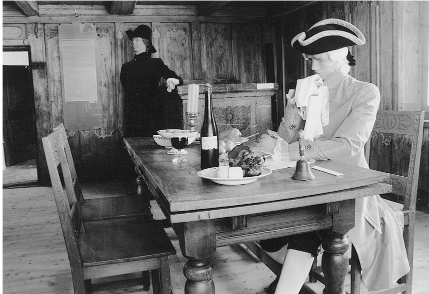
Abb. 4: ... zeigen neuere Museen unerwartete Themen mit neuen Darstellungsmitteln (oberschichtliche Kultur des Ancien régime im Museum von Ernen).