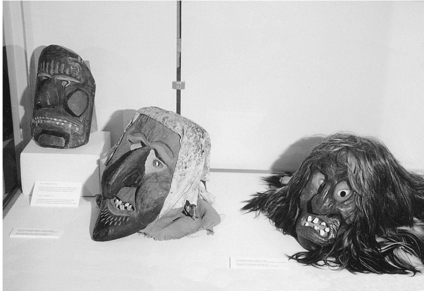
Abb. 6: ... was den zeitweiligen Rückgriff auf Bekanntes zur Überlebensfrage macht (Fastnachtsmasken im Lötschentaler Museum, Kippel).

selnden Themenausstellungen. Und in einem dritten Fall haben wir ein landesweit bekanntes Ausstellungszentrum wie die Fondation Gianadda (Martigny) vor uns, die mit der Präsentation grosser Namen regelmässig auswärtiges Publikum in grosser Zahl zu einer Reise in den Alpenkanton bewegen kann – keine andere Institution im Wallis vermochte bisher einen solchen Kulturtourismus zu begründen.