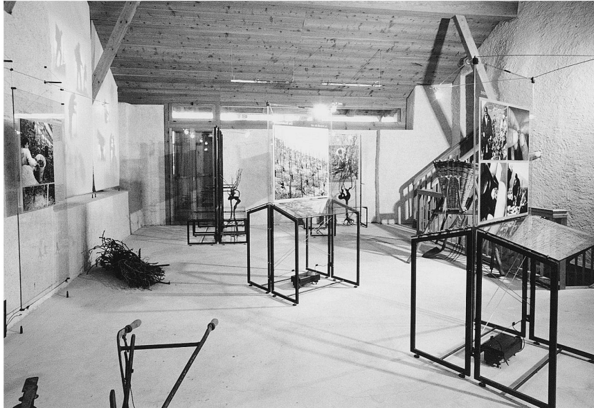
Abb. 2: Die in den letzten Jahren entstandenen, oft auf Sachthemen spezialisierten Museen mit ansprechender Präsentation zählen Frequenzen zwischen 3000 und 5000 BesucherInnen (Walliser Weinmuseum in Salgesch/Siders).

Schublade liegt. Dies ganz im Gegensatz zu Verbier, wo Architekt Pierre Dorsaz 1994 mit 1100 Quadratmeter Ausstellungsfläche sein privates Museum Espace Alpin eröffnete, nachdem er Jahrzehnte an der touristischen Entwicklung des Ortes «mitgebaut» hatte. Den aus Tagungszentrum, Restaurant, Museum, Kapelle und Ferienwohnungen bestehenden Komplex taufte Dorsaz Hameau de Verbier (Weiler von Verbier) – offenbar nicht mit dem gewünschten Erfolg, weshalb Museum und Restaurant 1998 zeitweise geschlossen wurden.