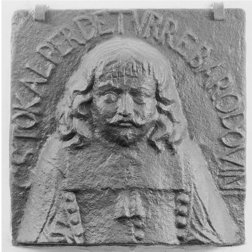
Abb. 2: Gusseisernes Porträt Kaspar Stockalpers vom Thurm im Innenhof des Palazzo Silva in Domodossola. Die gleichen Reliefs finden sich über dem Portal zum Arkadenhof des grossen Stockalperschlosses und über dem Eingang zum Dreikönigssaal im Treppenhaus des alten Stockalperschlosses in Brig