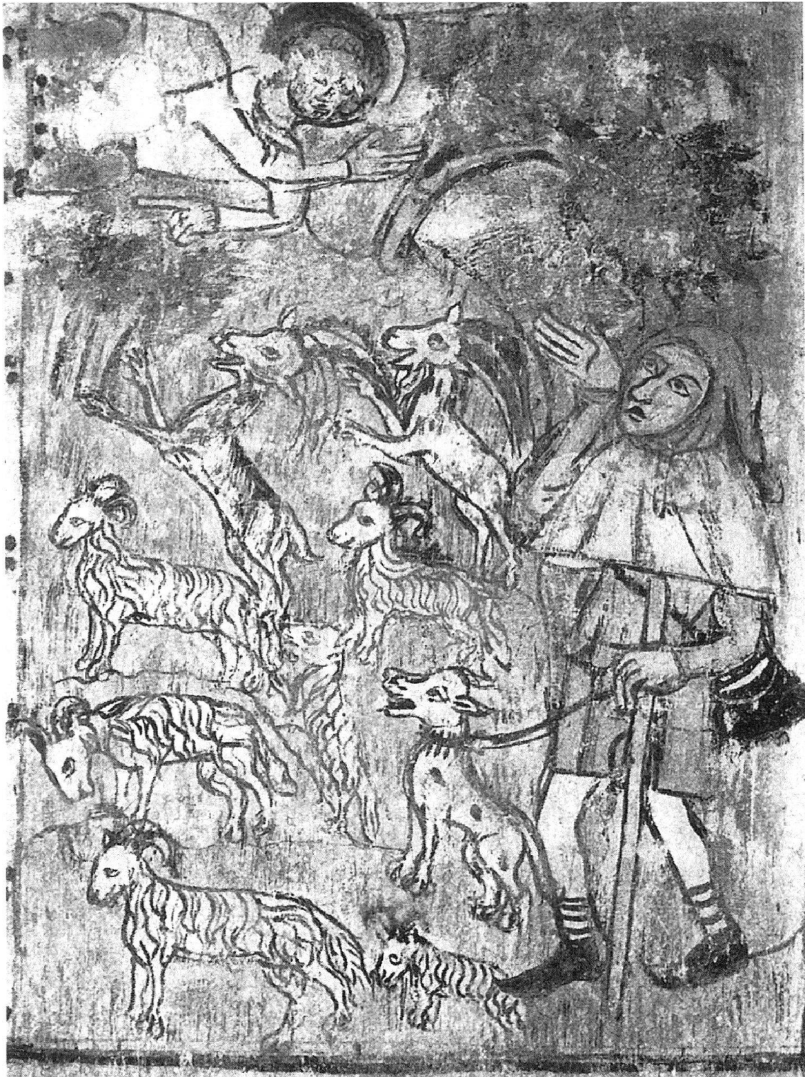
Abb. 2: Verkündigung an die Hirten. Fresko des Rhäzünser Meisters an der Westwand der Kirche St. Georg, Rhäzüns, zweite Hälfte des 14. Jahrhunderts. Steinböcke am Rande einer Ziegenherde.