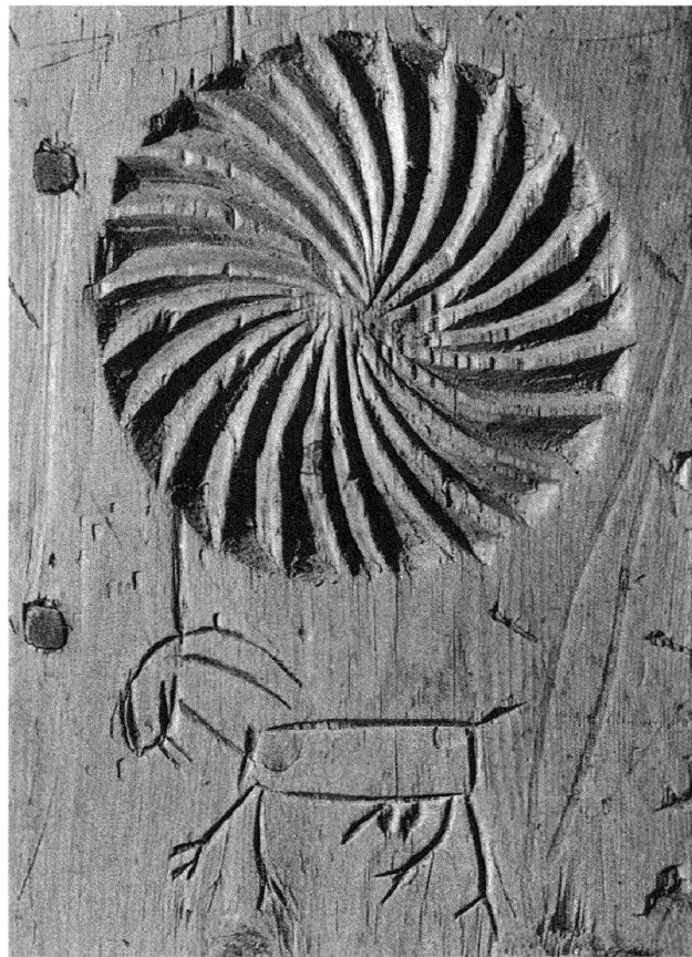
Abb. 4: Spätgotische Truhe aus dem Oberengadin: a) Unter den Kerbschnitzereien an der Front figuriert der Steinbock neben Rosetten und einem kleinen Jäger (Engadiner Museum, St. Moritz). b) Unterhalb einer grossen Rosette erscheint in improvisierter Schnitzerei der populäre Steinbock (Engadiner Museum, St. Moritz). Quellen: a) Handbuch der Bündner Geschichte , hg. vom Verein für Bündner Kulturforschung, Chur 2000; b) J. U. Könz, Das Engadiner Haus (Schweizer Heimatbücher 47/48), Bern 1952.