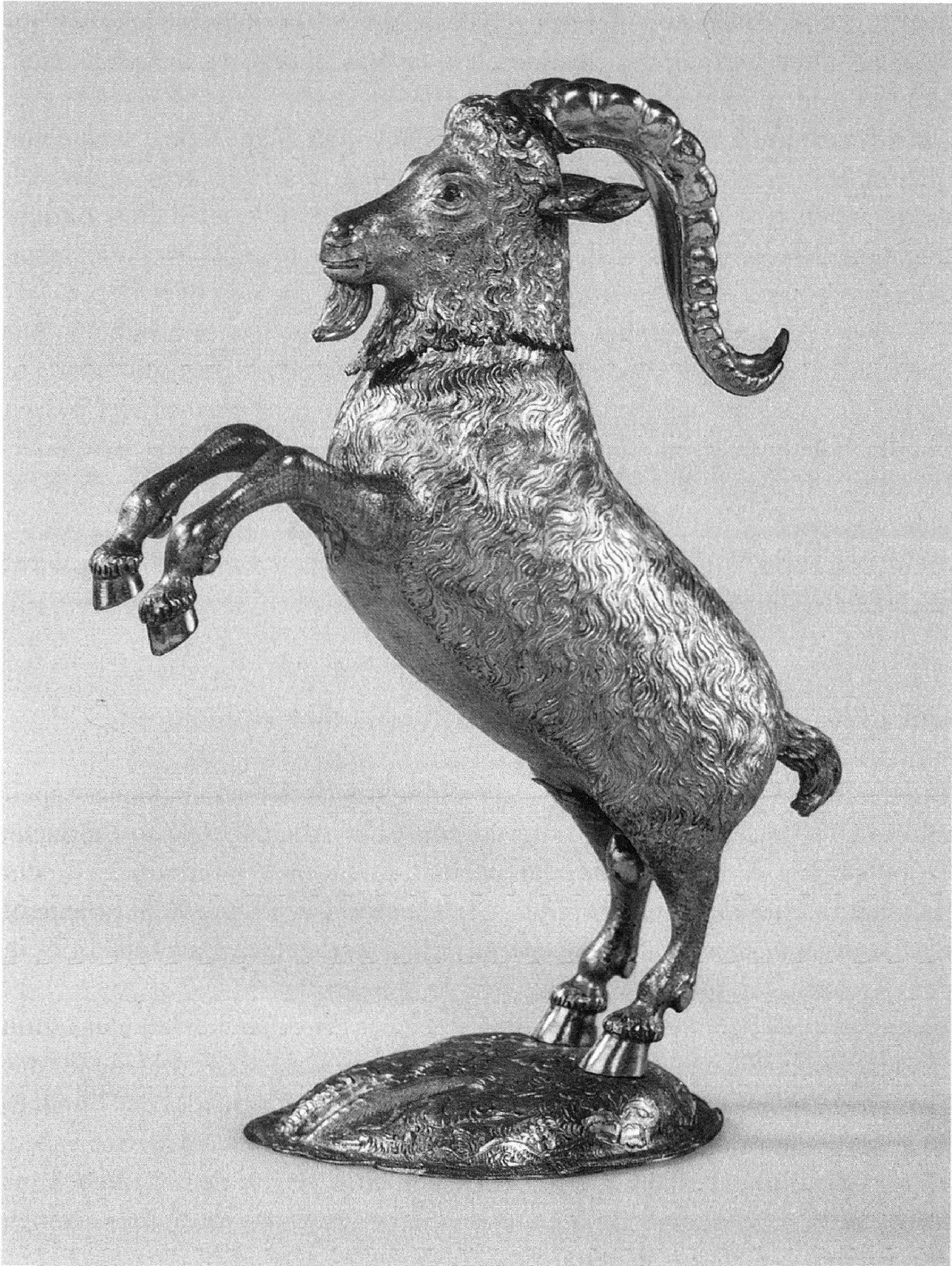
Abb. 3: Burgerbecher aus dem Churer Rathaus; Silber, gegossen, graviert und vergoldet, zweite Hälfte des 17. Jahrhunderts. Der abnehmbare Kopf bildet den Deckel des 23,3 Zentimeter hohen Trinkgefäßes, das auch als Tafelschmuck diente.